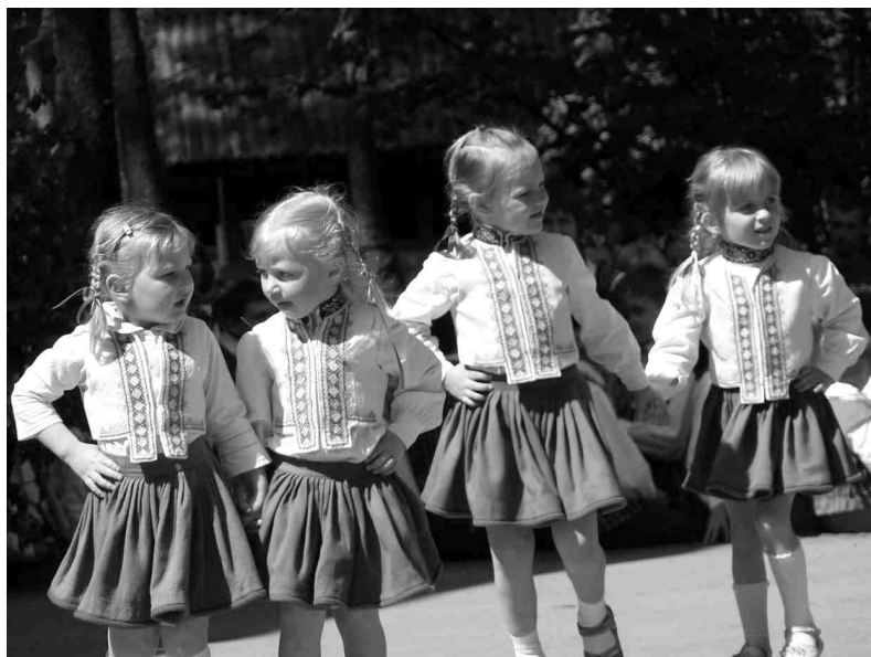
Kā ierasts, skatītāju vislielāko sajūsmu izraisīja pašu mazāko deju kolektīvu uzstāšanās.