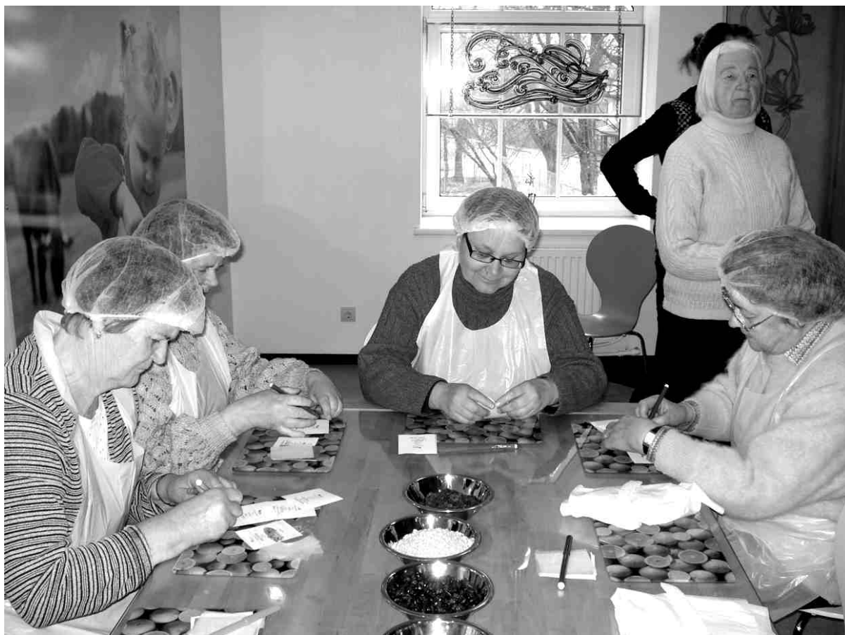
«Skrīveru saldumu» ražotnē katrs varēja izpētīt un izbaudīt konfekšu tīšanas procesu - ļoti pamācoši un aizraujoši!