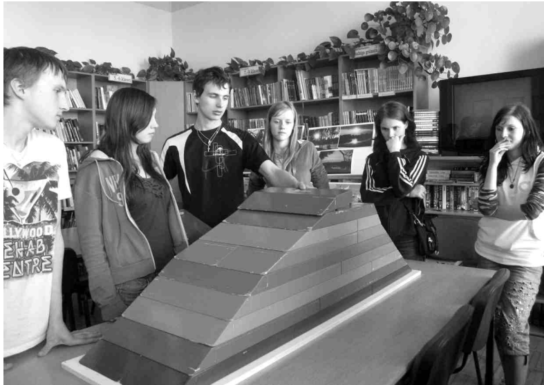
8.c klases skolēni būvē un izzina Gaismas pili.