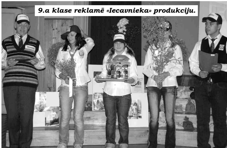
9.a klase reklamē «Iecavnieka» produkciju.