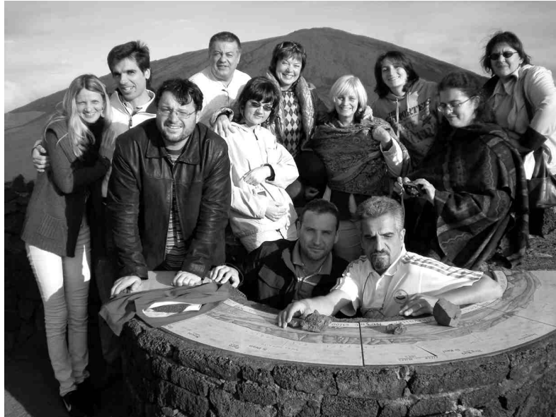
Projekta partneru grupa Reinjonā pie vulkāna, kurš ir gluži aktīvs.

Bet sākums tam visam ir skolā, kur skolēniem ir iespēja apgūt ilgtspējīgas attīstības mācību. Skolēni pēta ūdeni, gaisu, zemi,