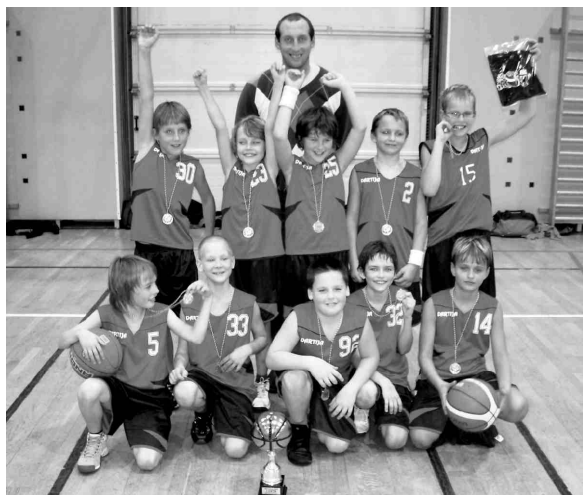
Saldā uzvaras garša - Iecavnieki ar izcīnīto VEF kausu.