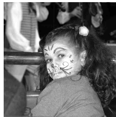
Tarkšķu koncerta fane ar studijā uzkrāsotu sejiņu. Par vienu latu katrs bērns varēja iejusties kāda zvēriņa, pirāta, klauna vai cita personāža tēlā.

Pulksten 10.30 pēc Latvijas laika pietājam Stokholmā, bet pēc pusstundas turpat pie ieejas termināli interesentus jau gaidīja gide un autobuss, lai vestu mūs divu stundu ekskursijā pa pilsētas skaistākajām vietām. Tā kā Stokholmā ar bērniem bijām pirmo reizi, tad noteikti gribējām šo iespēju izmantot. 1252. gadā dibinātās Stokholmas nosaukums tulkojams kā «pilsēta starp tiltiem». Un ne velti, jo 14 Stokholmas salas ir savienotas