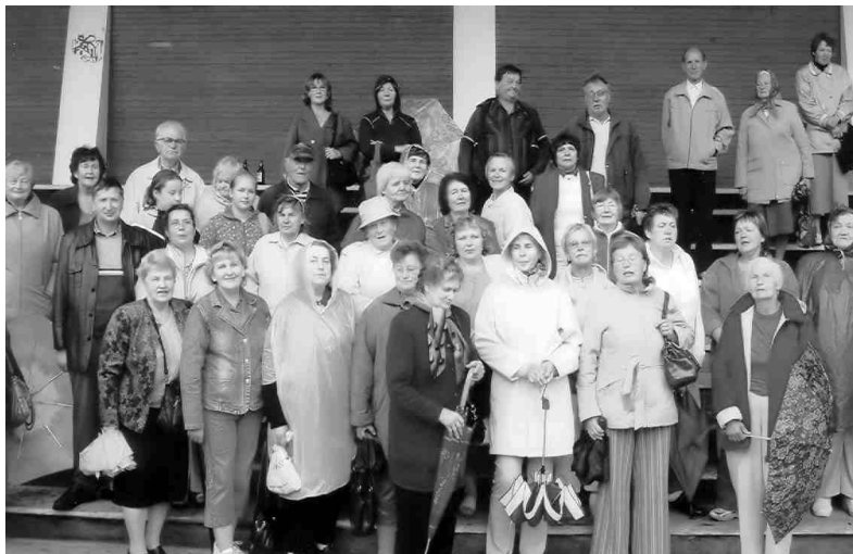
Ekskursanti Alūksnes estrādē.