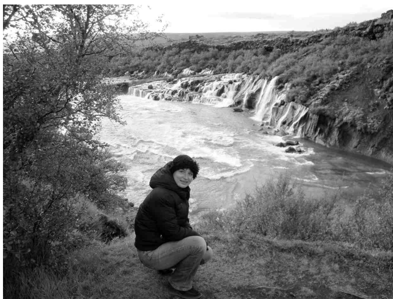
Pēcpusdienas bija atvēlētas Īslandes dabas apskatei.

Vasaras sākumā iesniedzu aģentūrā APA projektu par dalību pieredzes apmaiņas kursos. Tikai gandrīz augusta vidū uzzināju, ka esmu saņēmusi stipendiju šim braucienam, un ziņīgi sāku tam gatavoties. Kursu tēma tulkojumā no angļu valodas skan šādi: «Sensibilizācijas kursi par migrāciju, rasismu, diskrimināciju, kultūru un dažādību». Sensibilizācija nozīmē dalīšanos pieredzē un zināšanās, lai problēmu var atpazīt un saprast. Šī tēma man bija diezgan tuva, bet vēl diskutējama un atklājama. Par līdzīgām