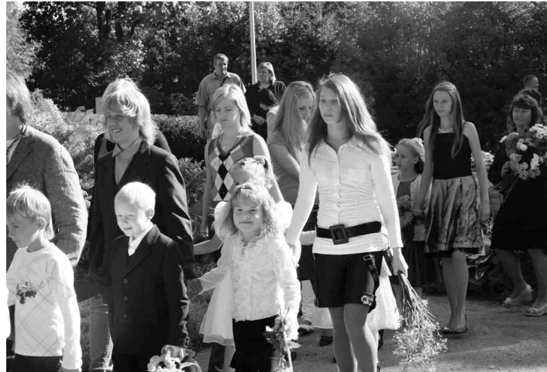
Vairāk fotogrāfiju skatiet internetā - www.iecava.lv galerijā.