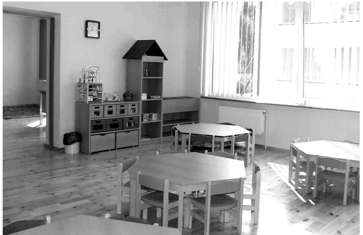
Ik rītu mazos sagaida mājīgi iekārtotās grupiņas krāsainā atmosfēra un rotaļlietas.