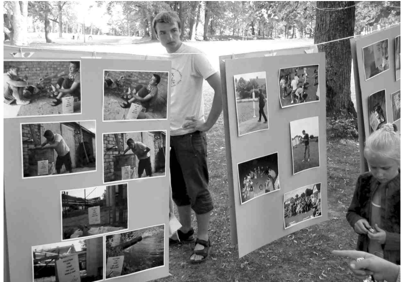
Festivāla dalībniekiem bija iespēja gan ieklausīties spāņu mūzikas ritmos, gan aplūkot projekta gaitā tapušos fotoplakātus.