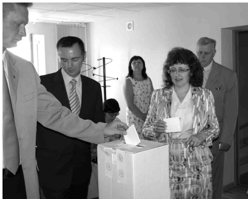
Domes priekšsēdētājs tiek ievēlēts aizklātā balsojumā.