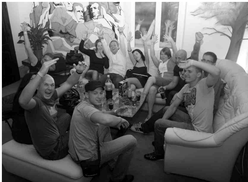
White House tauta atbrīvotā garā.