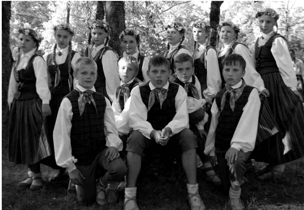
Aizvadītajā sestdienā modelēšanas koncertā Bauskas pilskalna estrādē piedalījās arī Iecavas vidusskolas 5. klašu deju kolektīvs.

Koncertā skanēja gan absolventu instrumenti, gan viņu apsveicēju priekšnesumi. Absolventi pārsteidza savus skolotā-