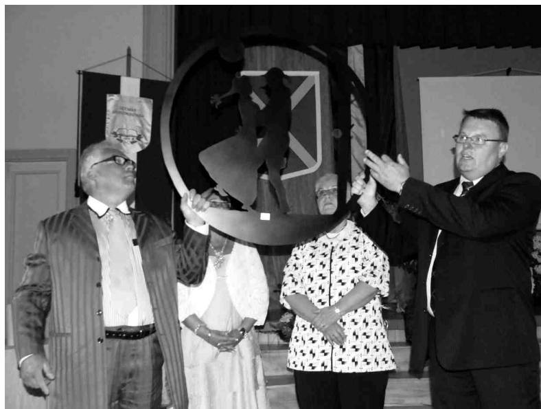
Latvijas draugi Iecavai sveica skolu ar simbolisku dāvanu - aicināja turpināt zviedru un iecavnieku sadarbību, gan strādājot, gan dejojot.