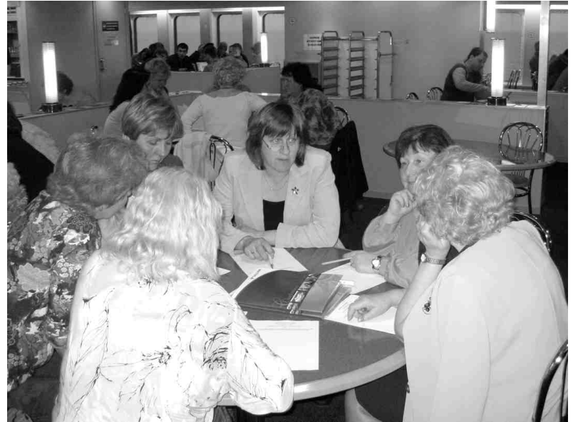
Semināra-foruma dalībnieces pieredzes apmaiņā.

No 26. līdz 28. aprīlim piedalījās seminārā-forumā «Kvalitatīva līdzdalības mehānisma attīstība politikas plānošanas procesos», ko organizēja Sieviešu tiesību institūts ( www.stinstituts.lv ). NVO speciālisti dalījās pieredzē par naudas piesaistes iespējām un sadarbību ar pašvaldībām, uzņēmējiem un sabiedriskajām organizācijām. Arī «Liepu» pieredze pārējām 90 foruma dalībniecēm likās interesanta un motivējoša. Patiesi liels bija prieks, ka Staiceles sieviešu klubs