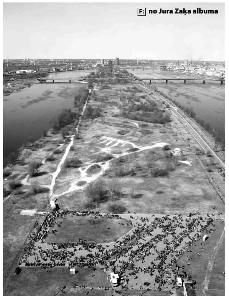
Pirms brauciena uz Jūrmalu motociklisti pulcējās pie televīzijas torņa.