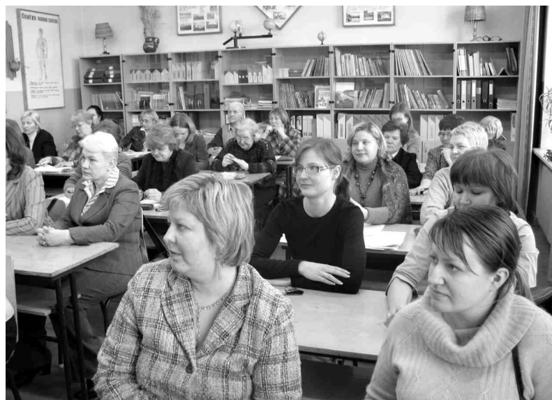
Skolotāju metodiskā darba konference.

teresībai un profesionalitātei, labi mūsu skolas skolēni kārtoti arī pārējos mācību priekšmetos.