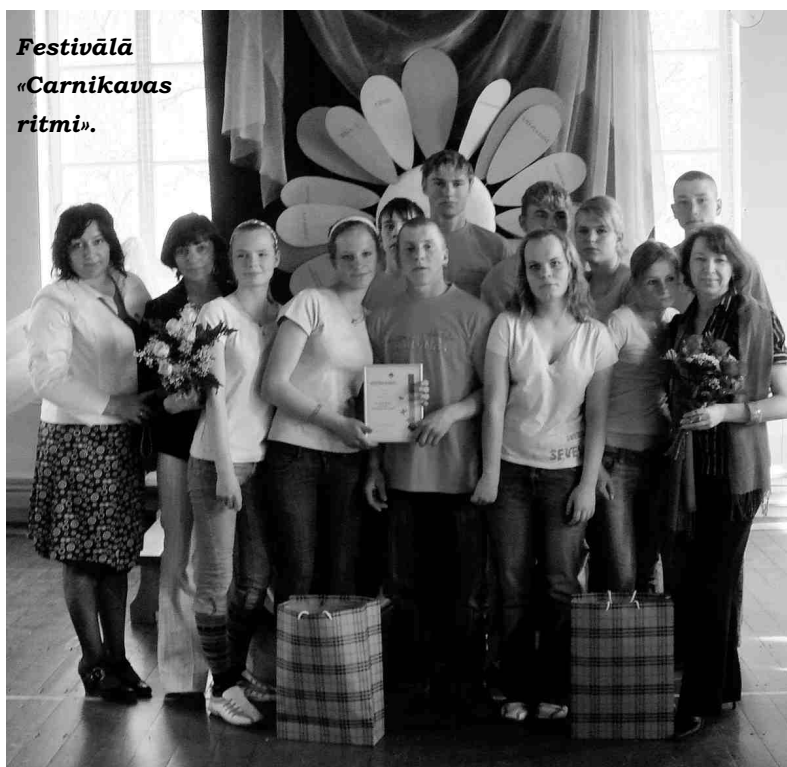
Festivālā «Carnikavas ritmi».

ties sponsoru atbalstam (a/s «Laima», SIA «LIDO», «BITE», SIA «Ādaži FOOD» u. c.). Lai pietiek