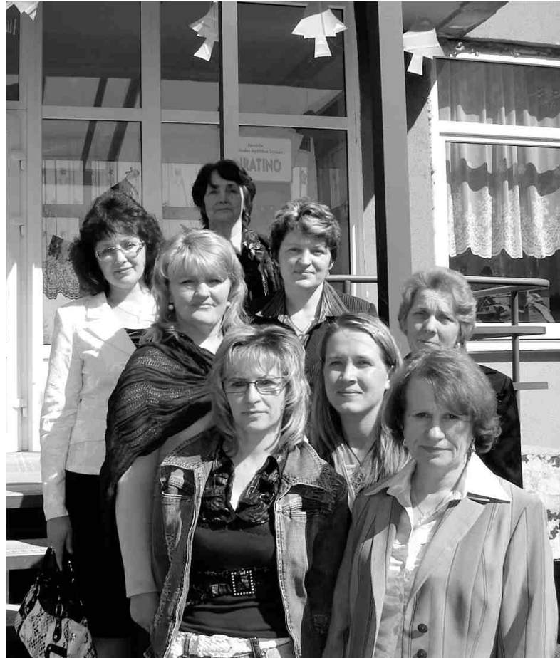
Pieredzes apmaiņas braucienā Valmierā.

Savā iestādē realizējam divas programmas iekļaujošajā izglītībā. Ļoti aktuāla pašlaik ir nostādne agrīnās diagnostikas jomā. Mēs ar savu speciālistu - psihologa, defektologa un logopēda - palīdzību jau savlaicīgi varam noteikt bērna speciālās vajadzības un nodrošināt atbilstošas, kvalitatīvas izglītības iespēju. Tādējādi palīdzība bērniem ar speciālajām vajadzībām tiek