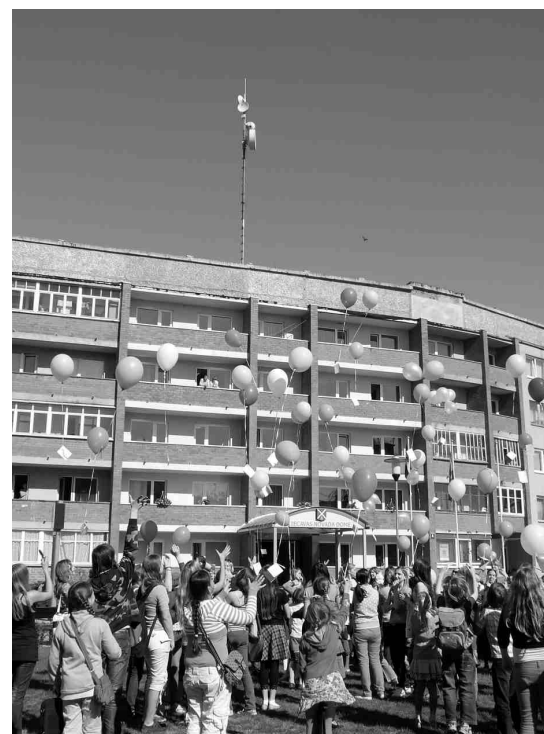
Iecavas mūzikas skolas audzēkņi, pedagogi un atbalstītāji akcijā «Iestādi ideju!».