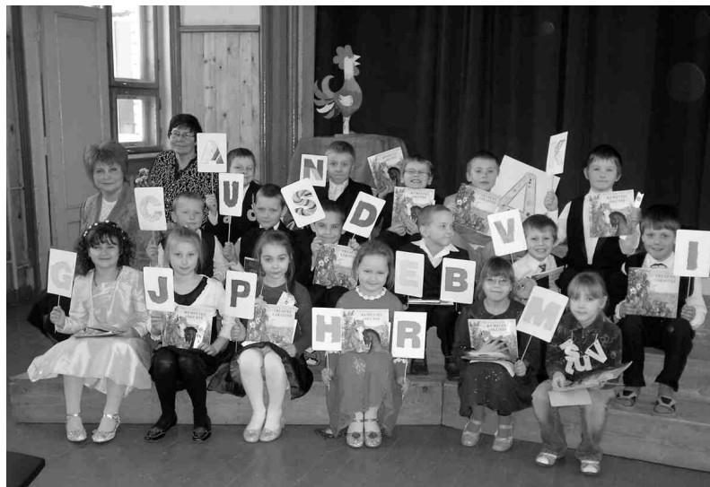
1. klase Ābece svētkos.

Mazs cilvēks nāks pie tevis, skolotāj, Viņš tūkstoš «kur?» un «kāpēc?» gribēs zināt. Un, kad pie dzīves kartes viņš jau stāj, Tev jālīdz īsto ceļu izdibināt. /I. Ziedonis/