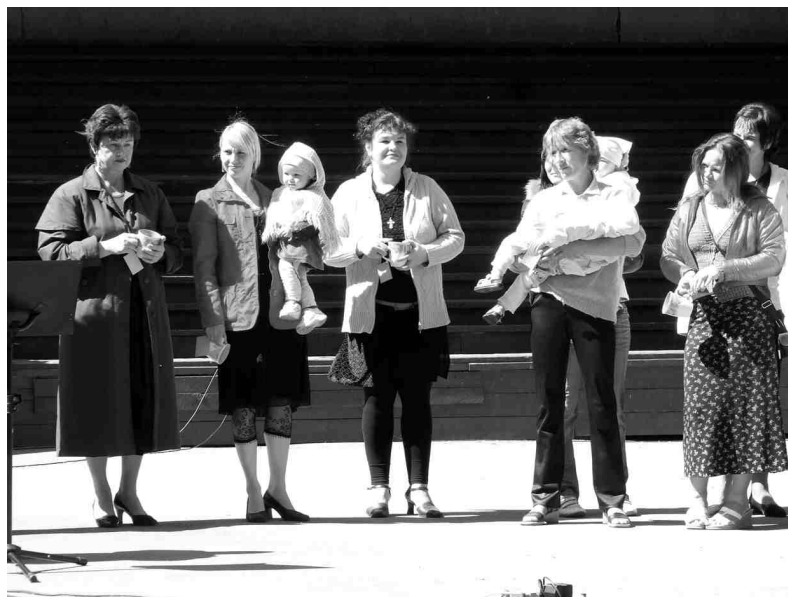
Māmiņas priecājās par iespēju izrauties no ikdienas rūpēm un pavadīt saulaino pavasara dienu kopā ar bērniem un citām māmiņām.