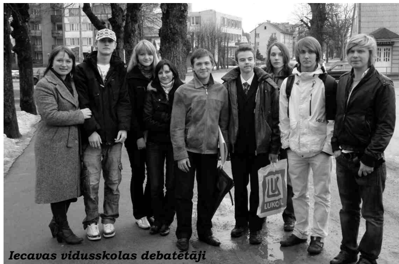
Iecavas vidusskolas debatētāji

Turnīrā piedalījās septiņas komandas latviešu valodā un deviņas komandas angļu valodā no Skaistkalnes vidusskolas, Bauskas 1. vidusskolas, Rīgas Valsts 1. ģimnāzijas, Ziemeļvalstu ģimnāzijas, Zolitūdes ģimnāzijas, Jelgavas Spīdolas ģimnāzijas un Iecavas vidusskolas. Tā kā mūsu skolas komandas debatēja angļiski, tad pretinieki mums bija Rīgas skolas un Jelgavas komanda. Prieks, ka jaunieši par tik nopiet-