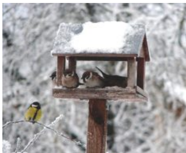
Gita Kravala Individuāliste