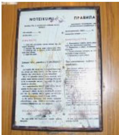
Liftu darba laiks ir plkst. 6-23. Nekur pie liftiem tas gan nav izlasāms.

Pēc garām debatēm lēmuma projekts tika noraidīts, jo balsojot to atbalstīja tikai četri no 10 deputātiem. Lēmuma projektā pēc SIA «Dzīvokļu komunālā