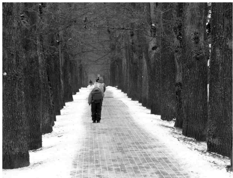
Pērn izbūvētais celiņš ne tikai labi iekļaujas vēsturiskajā ainavā, bet ir arī krietni uzlabojis gājēju pārvietošanās iespējas.