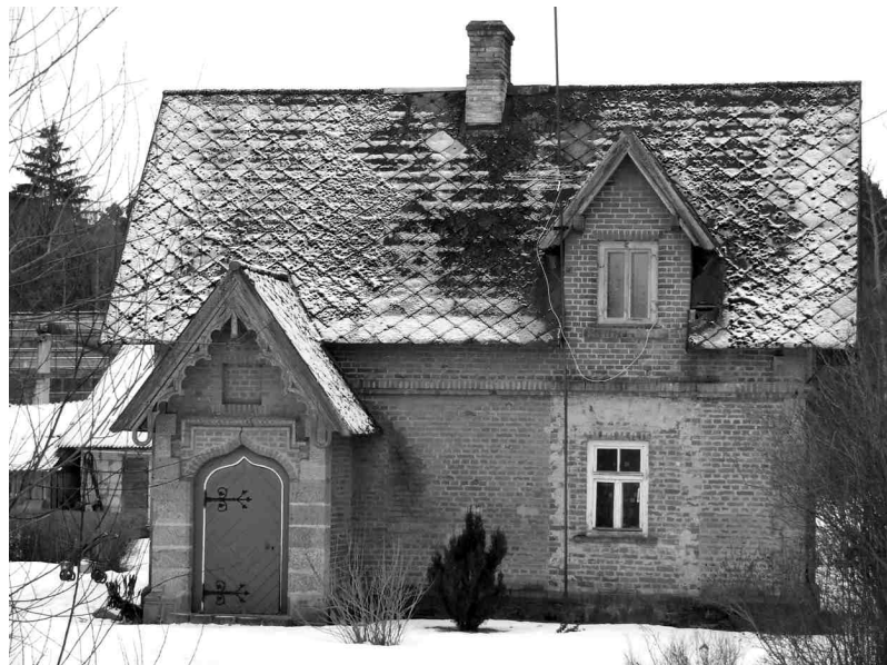
Kādreizējais muižas parka sargu namiņš Ozolu ielas tālākajā galā.

Jaunais celiņš ne tikai rada sakārtotas vides iespaidu, bet noteikti ir arī iepriecinājis tos, kas ikdienā mēro ceļu uz mājām vai bērnu dārzu – nu lietus vai atkušņa laikā vairs nav jālaipo starp dubļu lāmām. Dārzniece izsaka cerību, ka gājēju celiņu nākotnē varētu pagarināt vismaz līdz Ābeļu ielai, jo tagad tas apraujas līdz ar bērnu dārza teritoriju. □