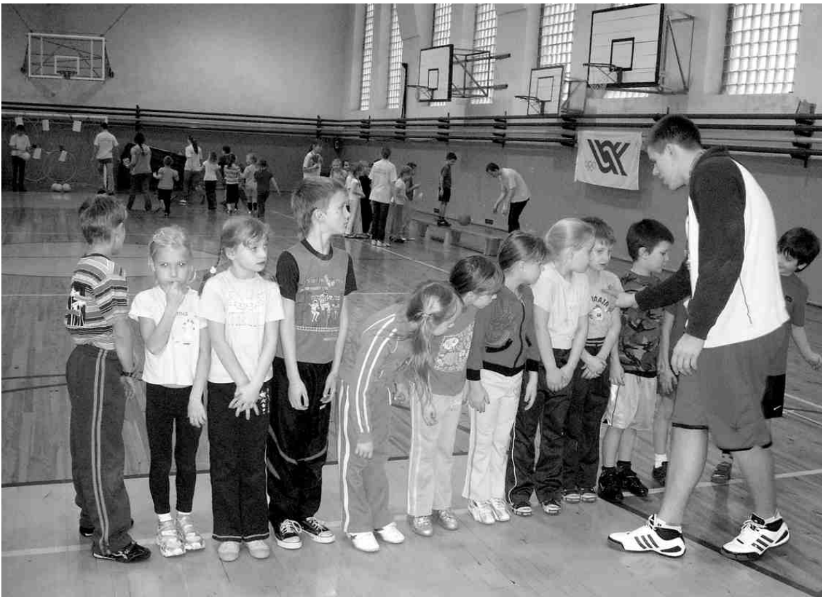
22. janvārī Iecavas vidusskolā notika «Olimpiskā diena» 1. klašu skolēniem. ➤ 2.lpp.