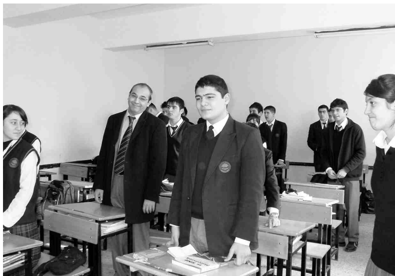
Angļu valodas stundā.

du - no 9. klases, mūsu bērnu vārdu krājums un valodas zināšanas vispār ir plašākas. Tāpat šie skolēni nevar lepoties ar moderniem mācību līdzekļiem. Vēl interesanti, ka bērniem jāiztur konkurss, lai varētu mācīties šai skolā. Skolotāji ar lepnumu stāstīja, ka te mācoties paši spējīgākie un labākie.