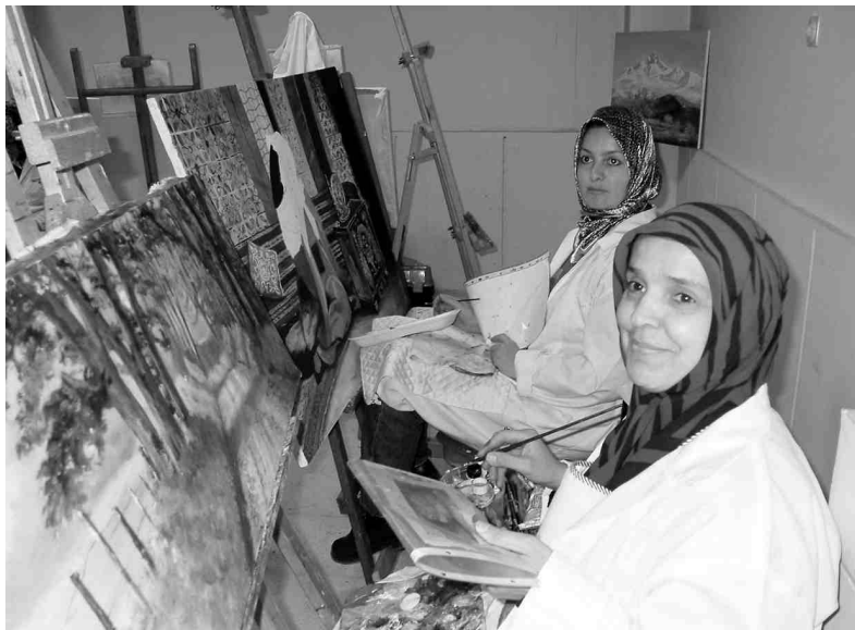
Turcietes glezno Kaiserī Kultūras centrā.