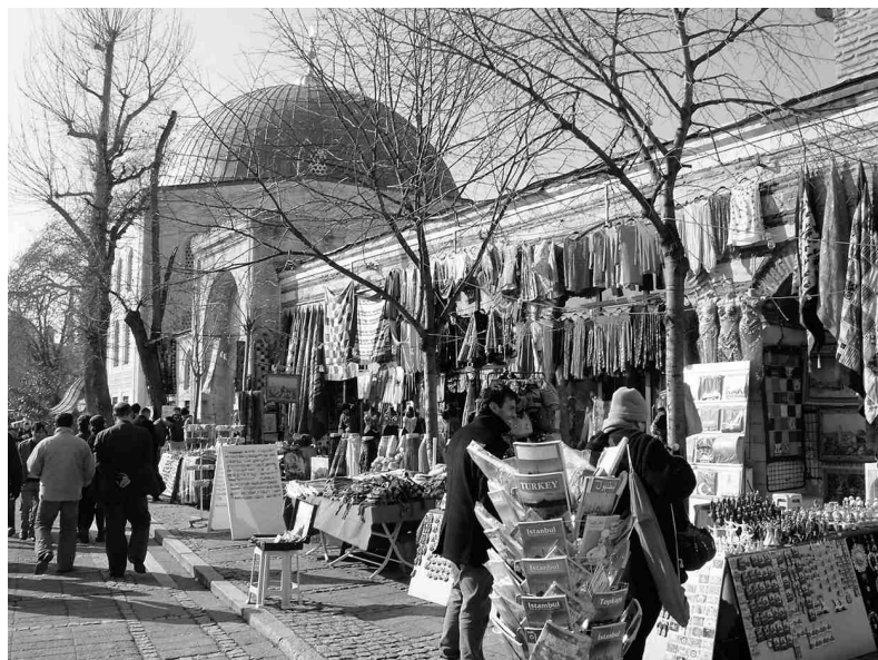
Tirgotava Stambulas centrā.

Visjaukāko pieredzi guvām kādā Kaiseri vispārīgā skolā, kur vērojām angļu valodas stundu 11.c klasē. Enerģisks skolotājs ar kuplām ūsām visu mācību stundu darbojās ar trīs teikumu formu iemācīšanu saviem atsaucīgajiem skolēniem. Jā, tādi viņi bija - gatavi skriet pie tāfeles, ja skolotājs tikai paskatījās uz viņiem, nemitīgi līdz domājoši, aktīvi. Tiesa gan, tā kā valodu viņi mācās tikai trešo ga-