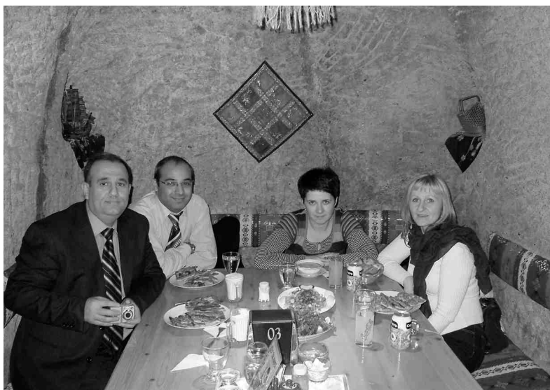
Pusdienojam restorānā, kas veidots alā.

par to, lai mēs katru dienu nogaršotu kaut ko no vietējās virtuves. Jau stāstīju par neskaitāmajām melnajām tējām, vairākkārt garšojām arī stipro, īpaši veidā pagatavoto turku kafiju,