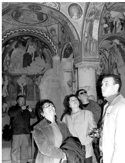
Aplūkojot kalnu pilsētiņu no ārpusē, ir grūti iedomāties, ka iekšienē slēpjas arī šādas freskām izrotātas baznīcas.

braucu. Otrs pasmaidīs, piebremzēs un ar smaidu palaidīs,