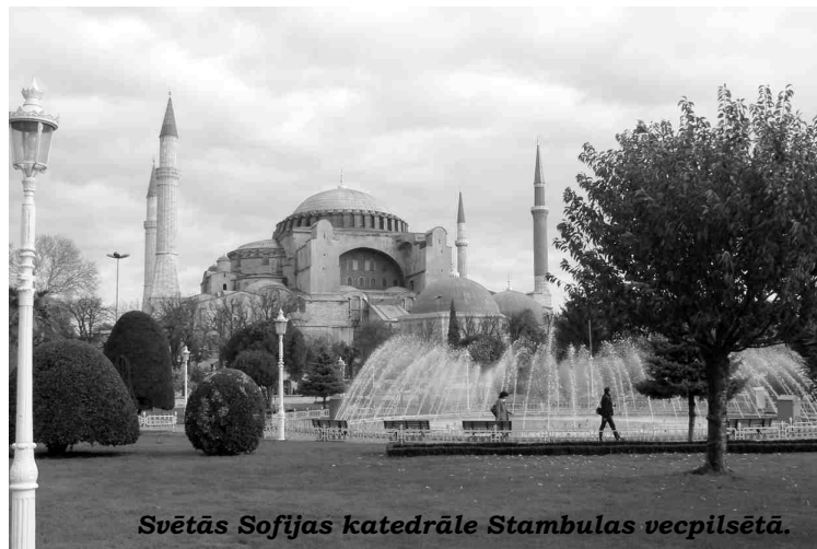
Svētās Sofijas katedrāle Stambulas vecpilsētā.

Apskatījām arī slaveno Bazilikas cisternu, ko turki dēvē par «nogrimušo pili», - milzīgu ūdenstvertni zem zemes pašā Stambulas centrā. To uzbūvējis imperators Justiniāns 532. gadā, lai aplenkumu gadījumā pilsētu nodrošinātu ar dzeramo ūdeni. Krēslainās telpas griestus atbalsta 336 izgaismotas marmora kolonnas, cauri akmens sienām tek sīkas ūdens straumītes, bet tvirtnes ūdeni danco dažāda lieluma zivis, liekot aizmirst par cilvēku burzmu augšzemē. ▣