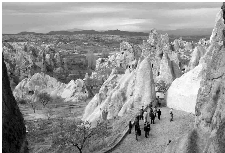
Kapadokijas kalni un tajos izveidotās pilsētiņas pa gabalu izskatās kā termiņu mājas. Ainava ir ļoti neparasta, un tā spēj pievilināt ne tikai tūristus - šeit uzņemt arī kadri filmai «Zvaigžņu kari».