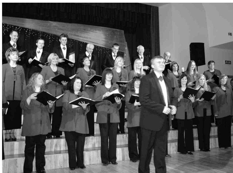
Jubilejas koncertā Iecavas jauktā kora rindās dziedāja 24 daiļā dzimuma pārstāves un 10 vīri.

«Ikreiz dziedāt ar mirdzošām acīm un justies kā koru karu da-