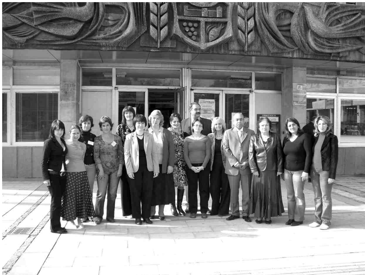
Projekta dalībnieki pie pašvaldības ēkas Vidinā. Vairāk foto skatiet portālā www.iecava.lv .

Interesanti bija apmeklēt bērnu dārzus; skatījām četrus. Uzņemšana bija ļoti sirsnīga - pie ieejas durvīm mūs sagaidīja tautas tērpos ģērbti bērni ar sālsmaizi; skolotājas - laipnas un smaidīgas. Bērnu dārzos strādā pēc valsts vienotas pirmsskolas izglītības programmas. Atbilstīgi programmai un bērnu vecuma grupai mācību nodarbības izmanto grāmatas - darba burtnīcas, kas ir vienādas visos bērnu dārzos. Joprojām grupiņās kopā ar mūsdienīgām rotaļlietām sadzīvo senāku laiku lietas: mēbeles, lelles, didaktiskās