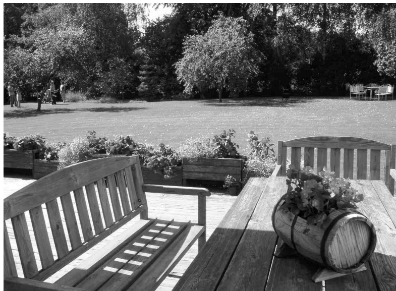
Terase pie Komisarū mājas labi noder atpūtai un ģimenes svētku svinēšanai, bet to var darīt arī tālāk dārzā, īpaši ierīkotā atpūtas stūrī balto bērzu paēnā, kur atrasta vieta arī ugunskuram un lielajam zupas katlam.