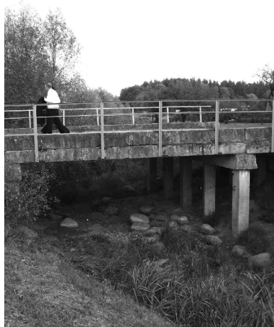
Ģedules upīte šoruden pilnībā izsusējusi.