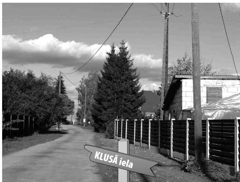
Klusās ielas sākums vairāk līdzinās pilsētas videi, jo ielu klāj asfalts, īpašumi priecē ar sakoptību.

puķu akcentiem acis priecē Cieļavū ģimenes īpašums Klusajā ielā 4. Sakoptība valda arī blakus esošajā Momotu ģimenes īpašumā un ap māju ielas pretējā pusē Klusajā ielā 1, kas gan savu krāšņumu un adreses norādi slēpj aiz bieza egļu dzīvžoga.