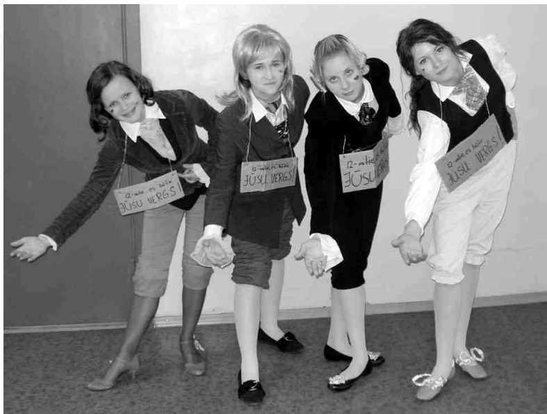
Karaļnama pārstāvju sveiciens.

«iesvētīšana». Šogad divpadsmitie bija pacentušies un iesvētību dienā īpaši pabrīdināja par to, ka jāvelk siltas drēbes, kuras var smērēt un pēc tam mest laukā. Šos vārdus izdzirdot, visiem 10. klases skolēniem bija jautājumi: «Ārā? Aukstumā? Netīriem?» Nomierinājušies un panku drēbes novilkusi, ap 14.00 visi ieradās Iecavas vidusskolā un pēc īpaša divpadsmito uzaicinājuma arī skolas sporta zālē.