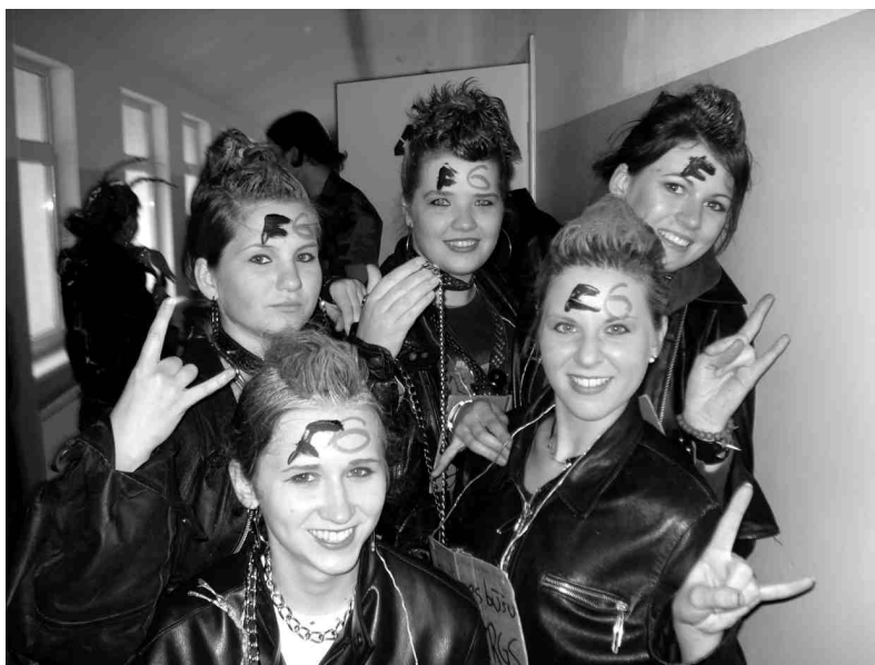
Krāsainas grebenes, ādas jakas, metāla ķēdes un brīvdomība Panku dienā.