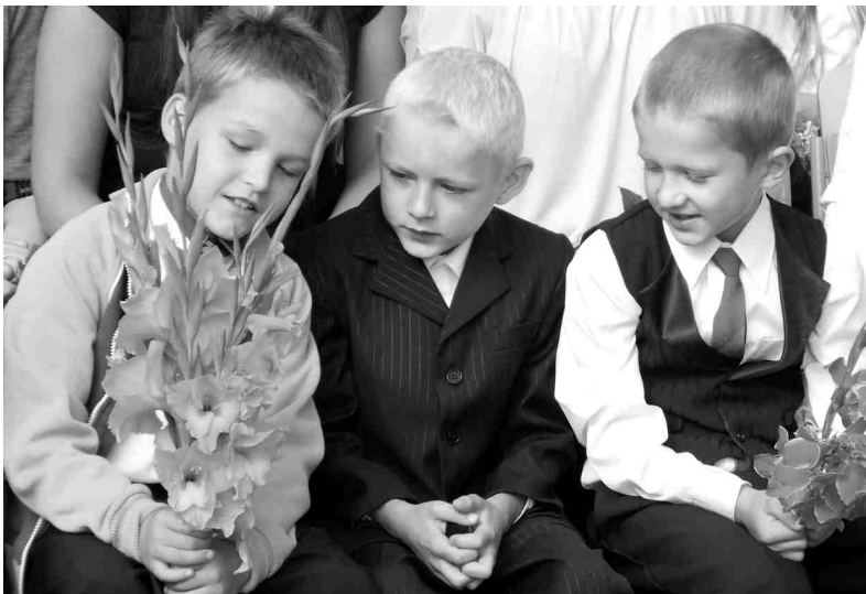
Dzimtmīsis pamatskolā mācību gaitas šoruden uzsāk 15 skolēnu. 1. septembrī skolas kolektīvs tikās svinīgajā pasākumā ārā, ar skatu uz iestādes vēsturisko ēku.