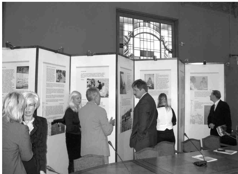
Saeimas deputāti vērtē skolēnu stāstus un fotogrāfijas.

Mums nevajag klausīties ciešanās, Kas mūs apspiež un nomelno. Mums nevajag skatīties cilvēkos, Kas savas dzīves nonicina. Mums nevajag sasmaržot pasauli, Kas tik melna un tumša no naida. Mums nevajag skriet pa pļavu, Kur nav pat zāles stiebru zaļu. Mums nevajag peldēties diķī, Kurš viscaur melnā piķī, Un mums nevajag saņemt šo naidu, Mums nevajag peldēt pa mākonī slaidu, Mums vajag zemē nolaisties Un turpināt cinīties!