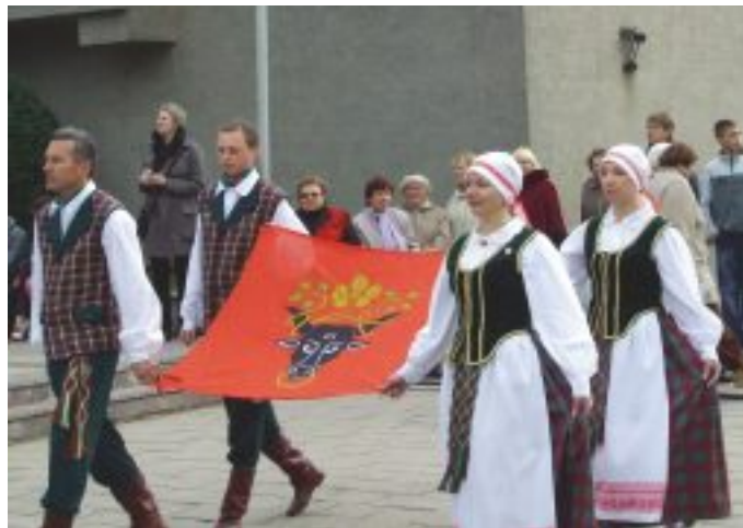
Pilsētas svētku atklāšana tiek ienests Pasvales karogs.