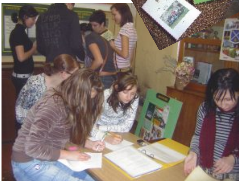
Izziņas process skolas muzejā.

zeju pasākumos piedalījās arī daudzu citu klašu skolēni, tikai mazliet pietrūka uzņēmības veikt noformēšanas darbus.