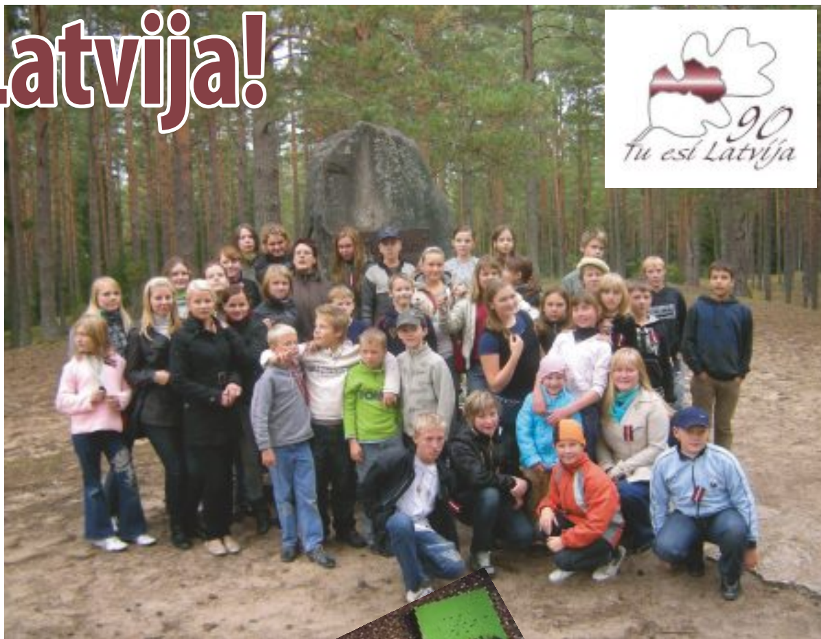
Konkursa noslēgums Tīreļpurvā. Muzeju apmeklējumu grāmatas.