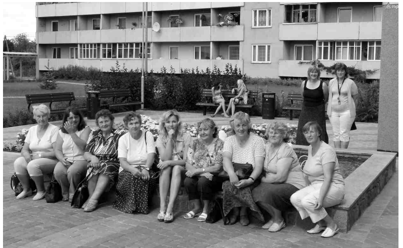
«Iecavā redzēto ir grūti salīdzināt ar mūsu pagastu,» atzīst jaunsaulietes.