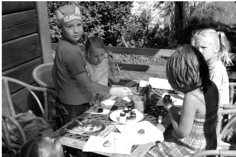
Uzminiet (attēlos pa kreisi), kurš baidās vairāk - meitenes no tumsas vai zēni no zupas vārīšanas?