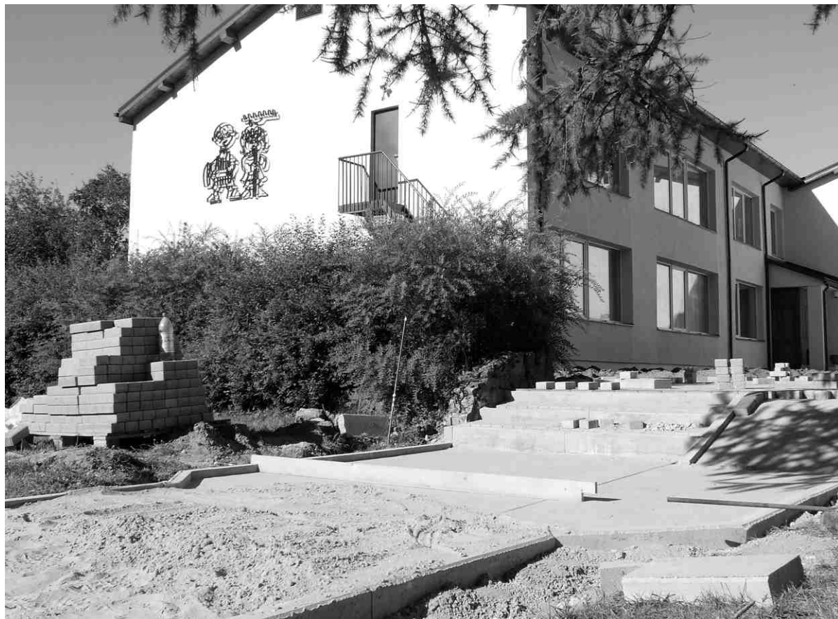
Teritorijas labiekārtošanas darbi rit pēc paredzētā grafika – objektam jābūt gatavam 15. augustā.

Tāpat būvnieki veiks pievadceļa un stāvlaukuma asfalta nofrēzēšanu, pamatnes izlīmeņošanu ar izfrēzēto materiālu un veltnošanu, kā arī veco ceļa apmaļu demontāžu un jaunu ierīkošanu. Šiem darbiem sekos pievadceļa un stāvlaukuma asfaltēšana četru centimetru biezumā, ietvju un asfaltēto laukumu robežās esošo komunikācijas skataku lūku augstumu regulēšana, kā arī melnzemes un grunts pievešana, līdzināšana starp sākumskolas laukumiem