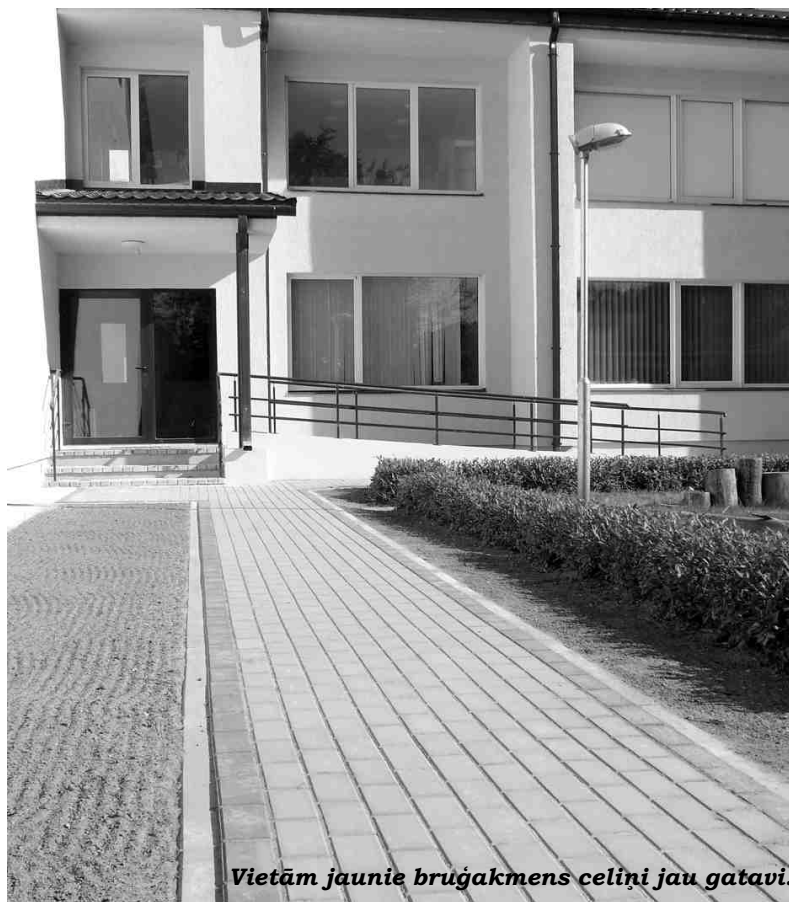
Vietām jaunie bruģakmens ceļi jau gatavi.

Lai Ozolu un Ābeļu ielas krustojuma tuvumā neveidotos lietus ūdens lāmas, plānots tajā izveidot ūdens pārplūdes zonu, izbūvējot jaunu asfalta segumu tādā augstumā, lai pa Ozolu ielu plūstošie lietus ūdeņi tecētu virzienā uz parka zaļo zonu. IZ