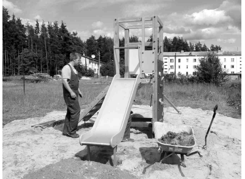
SIA «Jūrmalas Mežaparki» strādnieki ierīko rotaļu konstrukciju Dimzūkalnā.

Ar laiku rotaļu laukumus varētu papildināt ar smilšu kastēm un soliņiem, lai bērni tur varētu spēlēties un tā būtu satikšanās vieta arī viņu vecākiem. IZ