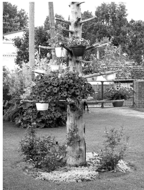
Ziedošs akcents Vītolu ģimenes dārzā Zālitē.