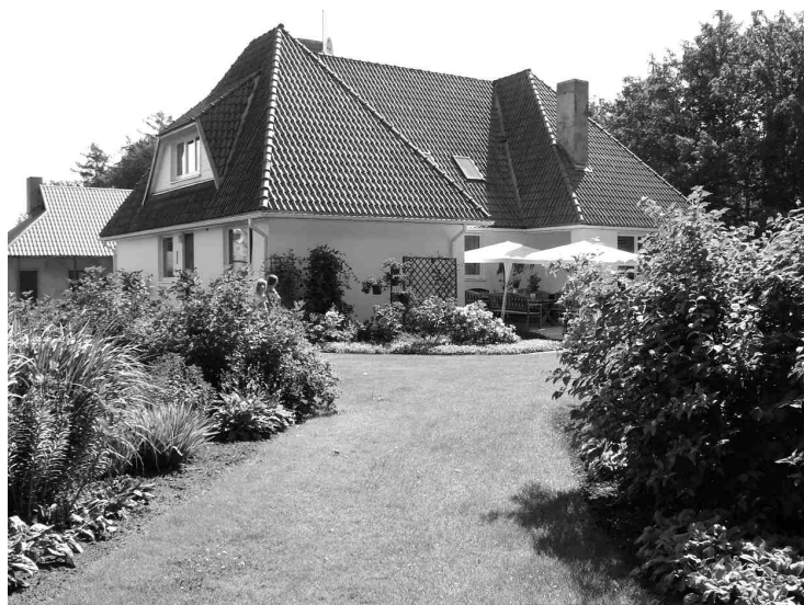
Komisarū ģimenes dārzs pārsteidz gan ar stādījumu daudzveidību, gan ar plašuma un mājīguma izjūtu. Ne velti pagājušā gada Latvijas dārzkopības un biškopības biedrības rīkotajā konkursā par skaistāko Latvijas daiļdārzu un lauku sētu tas plūca laurus nominācijā «Skaistākais daiļdārzs».