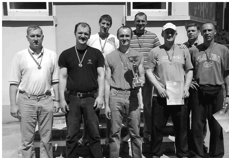
Bauskas rajona basketbolisti - 45. sporta spēļu čempioni.

Šie panākumi uzskatāmi par ievēribas cienīgiem vēl jo vairāk tāpēc, ka tāda rajonu pārstāvēniecība Latvijas Veterānu savienības mačos acīmredzot ir pēdējā pirms nākamgad paredzētās administratīvi teritoriālās reformas. IZ