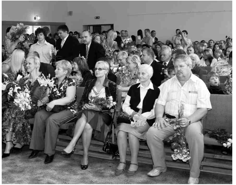
Tradicionāli izlaidumā pateicības vārdi un ziedi tiek arī absolventu vecākiem.