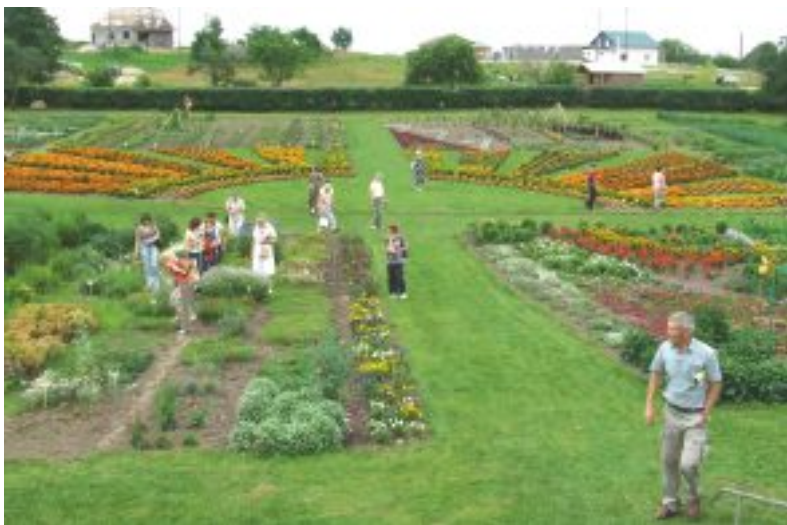
Košās demonstrējamās dobes uzņēmumā «Kurzemes sēklas».