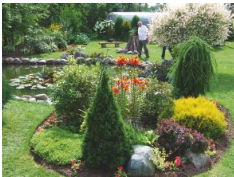
Vijās izbaudījam harmonijas un miera klātbūni.