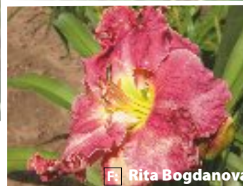
Nākamgad daudz iecavnieku dārzus rotās selekcionāra Viļņa Baņģiera dienziedes.