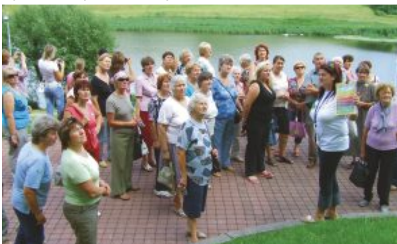
Iecavas puķu mīļi ekskursijā pa pilsētu. IZ

SIA «Dzīvokļu komunālā saimniecība» no 28. jūlija līdz 1. septembrim rīko vienreizēju akciju par komunālo maksājumu parādu nomaksu.