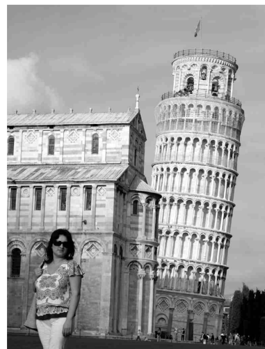
Pizas tornis vēl savā vietā!

piedāvā, tai skaitā arī slavenā kājāmgājēju tilta Ponte Vecchio burvīgo atmosfēru.