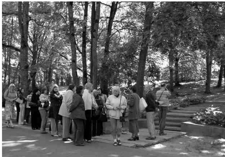
Rīgas rajona viesi izstaigāja Iecavas parku un noklausījās īsu Iecavas vēstures apskatu.

43 Rīgas rajona un Bauskas rajona pieaugušo izglītības koordinatori pulcējās viesu namā «Dārta», kur notika pieredzes apmaiņas pasākums. Pieaugušo izglītības koordinators kustība Bauskas rajonā aizsākās 2002. gadā, kad gandrīz visos pagastos pašvaldību vadītāji atzina, ka pieaugušo izglītība ir pietiekami svarīga, lai kādam no darbiniekiem uzticētu to organizēt. Pārsvārā gan šie pienākumi bija sabiedriski - par tiem pašvaldība nemaksāja. Tā nu pieaugušo izglītības koordinatori