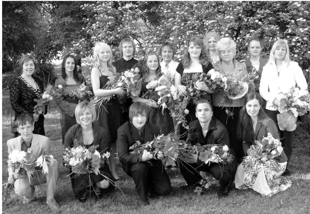
Iecavas mūzikas skolas absolventi un skolotāji 29. maijā.