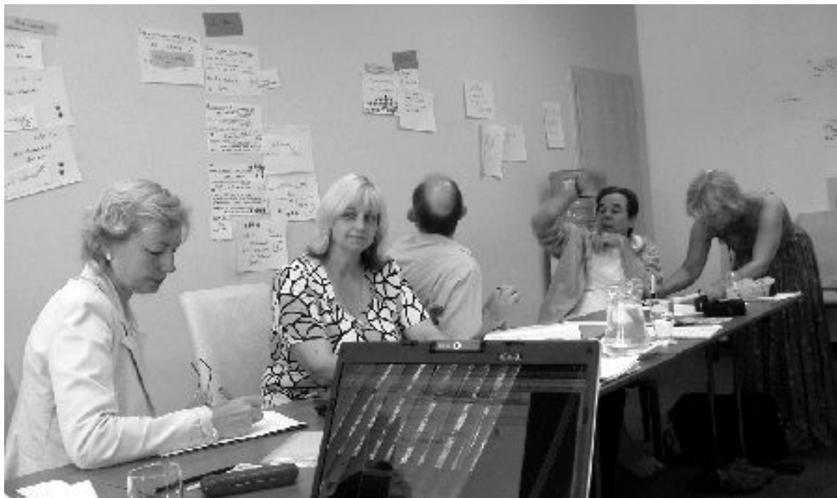
Projekta darba grupa Jūrmalā izstrādā materiālus rokasgrāmatai.

Projekta partneri ir eksperti jautājumos, kas attiecas uz pieaugušo izglītību, bet bieži šādās tikšanās reizēs partneri pārņem vislabāko pieredzi jomā, kas saistīta ar projekta tēmu. Arī tagad, tiekoties Latvijā, secinājām, ka Apvienotā Karaliste un tieši Devonas novada Dome jautājumos, kuri saistīti ar pašvaldības sadarbību ar nevalstisko sektoru un dažādām sabiedrības grupām, ir pieredzes bagātāka par citām partneru organizāci-