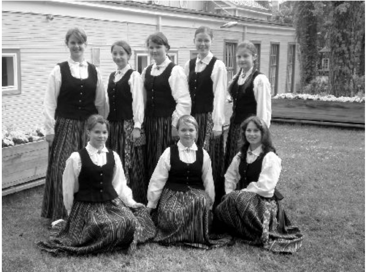
«Uguntiņas» koklētājas muzicēja Dzintaru koncertzālē.

Koncertu krāsaināku darīja un skatuves putekļiem griezties