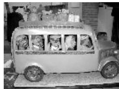
Māla izstrādājumi mēdz būt arī tik amizanti...

Spānijas partneri bija sagādājuši mums iespēju apmeklēt Madridi, Prado mākslas galeriju, seno pilsētu Toledo, kā arī mūsdienīgu vīna darītavu. Kā zināms, Spānija ir viena no lielā-