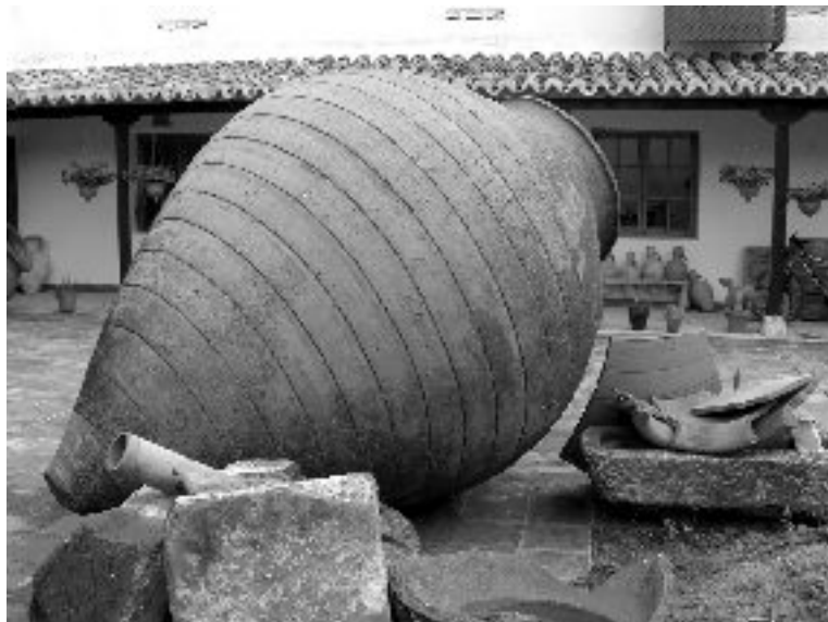
Apskatījām Traukus ar Spānijai raksturīgiem tautas rakstiem, krūkas ūdens pārnēsāšanai un mucas vīna glabāšanai.