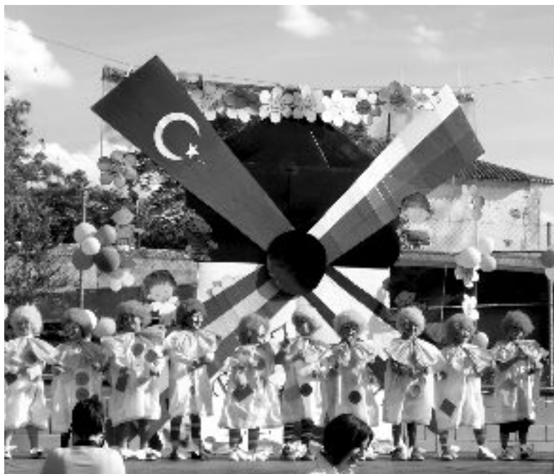
Festivālā katra klase un bērnudārza grupiņa piedalījās ar saviem priekšnesumiem - dziesmām, dejām, teātra izrādēm. Skatuves noformējumā - projekta dalībvalstu karogi.

Socuellamos skolā ir trīs pirmsskolas grupiņas. Bērni tur izglītojas, rotaļājas un darbojas līdz plkst. 14.00, tad kopā ar vecākiem dodas uz mājām. Pēcpusdienā ir siesta - laiks, kad spāņi atpūšas un guļ, bet pēc tam atkal dodas uz darbu. Pa-