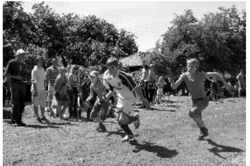
Liela piekrišana šoreiz stafetes skrējieniem.

Laureātu saraksts un vairāk foto - www.iecava.lv