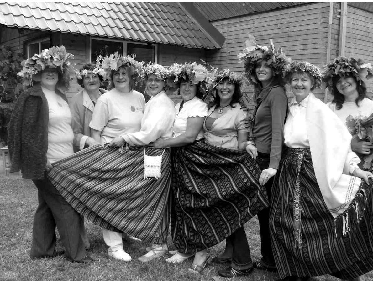
Sagaidot vasaras saulgriežus, Iecavas sieviešu klubs «Liepas» jau piekto gadu organizēja uguns rituālu. 4.lpp.