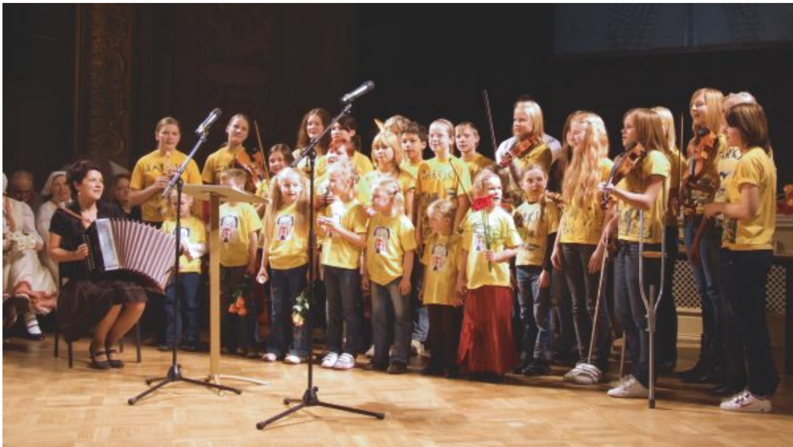
«Tarkšķi» Folkloras gada balvas pasniegšanas pasākumā Rīgas Latviešu biedrības namā.

Ļoti ceram maija beigās saorganizēt gada noslēguma koncertu par prieku mūsu radiņiem un draugiem, kā arī 24. un 25. maijā pošamies uz festivālu «Pulkā eimu, pulkā teku», kas šogad risināsies Rīgā, Brīvības muzejā, Rātslaukumā, Tehniskajā Universitātē, kā arī Saļaspils Botāniskajā dārzā. IZ