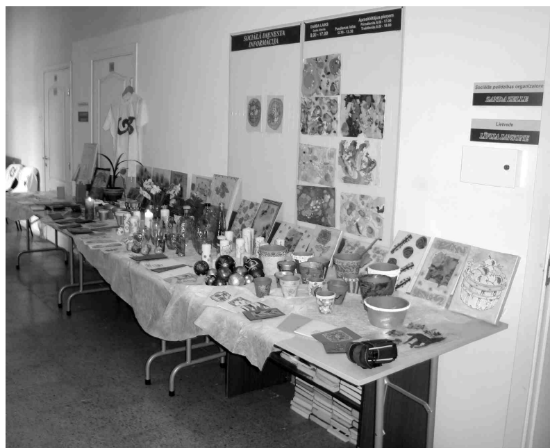
Vizuālās mākslas darbu izstāde Sociālajā dienestā.

Dažām Iecavas novada sabiedrības grupām rūpes sagādā bezdarbs un sociālās problēmas, tādēļ Sigma Strautmale projekta ietvaros vēlējās sekmēt cilvēku resursu attīstību nodarbinātības