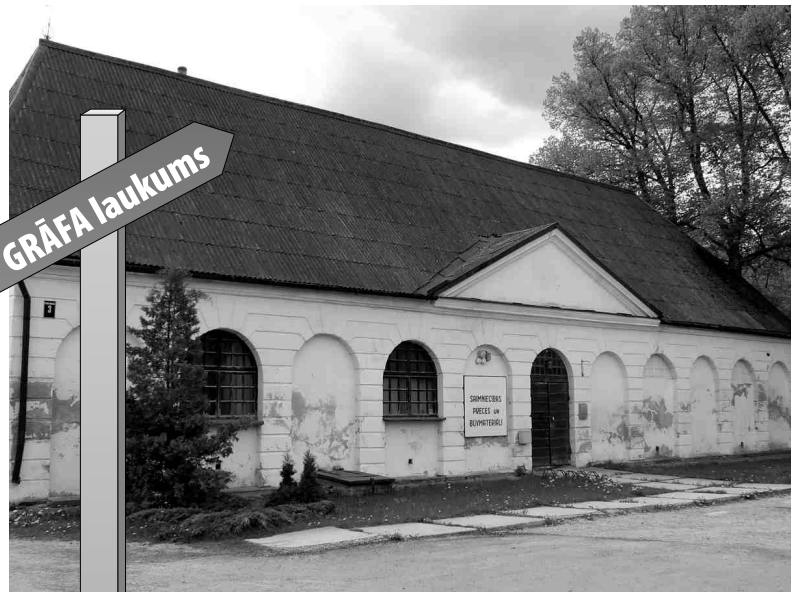
Saimniecības preču un būvmateriālu veikala ēka.