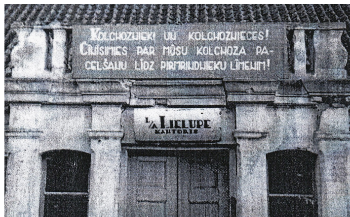
Kolhoza “Lielupe” kantoris