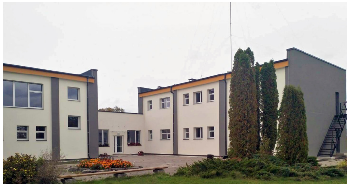
Viesturu kultūras centrs jaunā fasādē.

tumnīcefekta gāzu samazinājumu gadā par vismaz 68,742 CO2 ekvivalenta tonnām, salīdzinot ar situāciju pirms projekta.