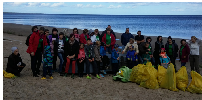
Čaklo talkotāju kopbilde vēsturei.

sakopšanas darbi ritēja pēc viena plāna. 20.septembrī pulksten 10:00 mēs - 30 mārupuķeni (darbinieki, vecāki un bērni) - ieradāmies izvēlētajā Tīrrades pos-