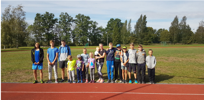
Labākie no labākajiem izturībniekiem.

Bauskas pilsētas stadionā norisinājās ikgadējie vasaras sporta svētki cilvēkiem ar funkcionāliem traucējumiem. Rundāles novadu divas reizes gadā pārstāv komanda 10-12 cilvēku sastāvā, kas veiksmīgi startē un regulāri ieņem godalgotas vietas.