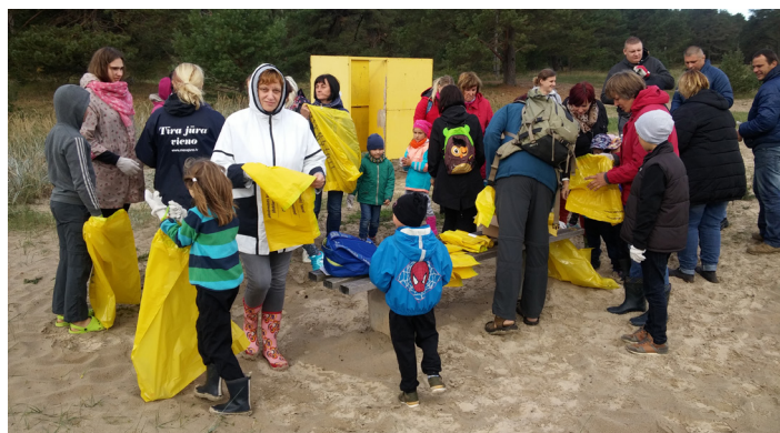
Ierodamies Ķesterciemā, saņemam maisus un cimdsus un kopīgiem spēkiem dodamies Latviju padarīt tīrāku.