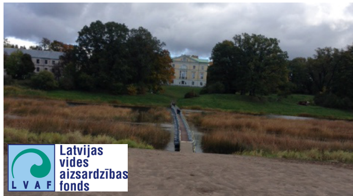
Izveidots laukums automašīnām, izbūvēts gājēju celiņš pie Mežotnes pilskalna.

2018.gada 30.janvārī tika noslēgts līgums ar SIA “Kvintets” par laukuma pie gājēju tiltiņa pār Lielupi un gājēju celiņa pie Mežotnes pilskalna izbūvi