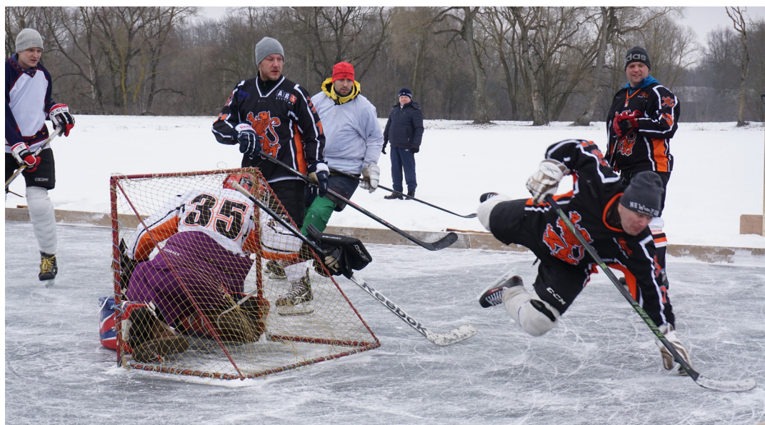
Spēles karstums - „Bauskas Red Wings” pret „Vecsaules amatierēātri”