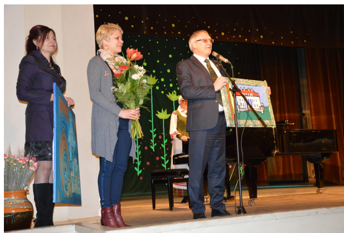
Dāvanā sadraudzības pašvaldībai Pakrojāi šogad tika pasniegta mazo mārupuķēnu radītā glezna, kurā atainota Pakrojas muiža

16.februārī Rundāles novada delegācija, atsaucoties Pakrojas rajona pašvaldības ielūgumam, piedalījās Lietuvas neatkarības dienas svinībās Pakrojojā.