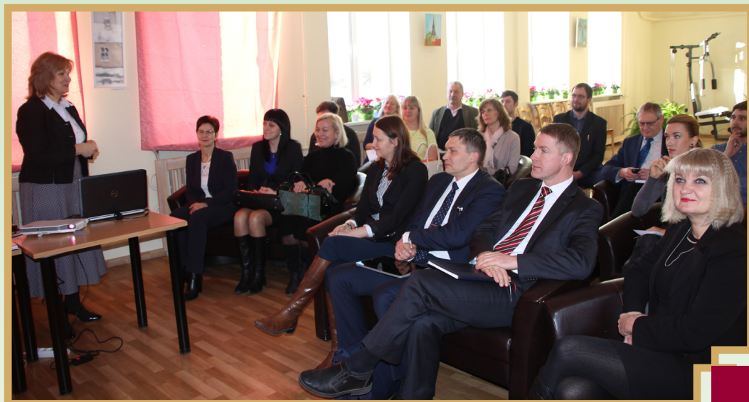
Attēlā augšā: 10.februārī Bērstelē pulcējās vietējie esošie un topošie uzņēmēji, konsultatīvās padomes pārstāvji, dažādu nozaru speciālisti

Aplams ir apgalvojums, ka novadā nekas nenotiek, visur