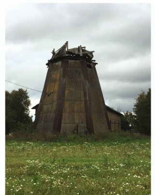
Dzirnavas. 1950.g. foto no Ā.Nākmanes arhīva, 2016.g. S.Upītes foto.