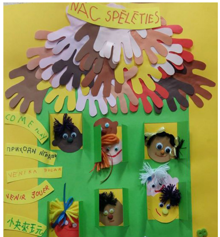
SPII „Saulespuķe” Ķīparu grupas veidotā kolāža „Nāc spēlēties”

UNESCO sadarbībā ar leicības, psiholoģijas un izglītības izpētes un metodoloģijas centru (Maskava, Krievijas Federācija) rīkoja starptautisko radošo darbu konkursu bērniem un jauniešiem „Atvērsim sirdis un prātus bēgļiem” (“Opening hearts and minds for refugees”). Konkursa mērķis bija veicināt bērnu un jauniešu izpratni par bēgļu tiesībām un savstarpējo cieņu. Konkursā piedalījās UNESCO Asociēto skolu projekta dalīb-skolas no visas pasaules.