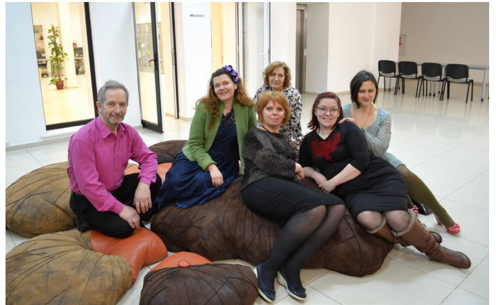
“Baltās mājas” gleznošanas studijas dalībnieki