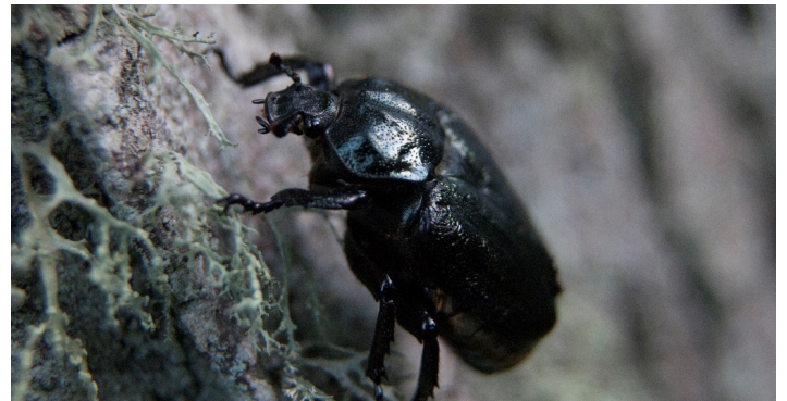
Attēlā: Lapkoku praulgrauzis. Viens no dabas daudzveidības simboliem. Aizsargājams.

10.februārī Pilsrundāles vidusskolā notika zinātniski pētniecisko darbu (turpmāk ZPD) konference. Tajā piedalījās 10.klases skolēni kā klausītāji, jo viņiem zinātniskais darbs būs jāiesniedz nākamajā mācību gadā, un 11.klases skolēni, kuri savu veikumu prezentēja. Tika pārstāvētas tādas sekcijas kā bioloģija, latviešu valoda, fizika, psiholoģija, latviešu valoda, fizika, psiholoģija, vēsture un kulturoloģija. Tika noklausītas 8 darbu prezentācijas. Vērtēšanas komisija – trīs cilvēku sastāvā.