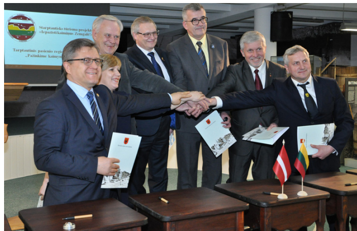
Attēlā: Biržu, Pasvales, Pakrojas, Vecumnieku, Bauskas, Iecavas un Rundāles pašvaldību vadītāji paraksta sadarbības līgumu