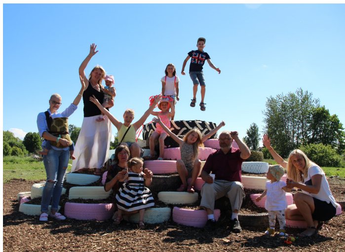
Laukumiņa atklāšanas pasākumā vienkopus tikās vairākas paudzes /Vairāk foto meklē www.rundale.lv/

Bērnu smiekliem un jaunrām čalām skanot, krāsainiem baloniem rotāts, 15.jūnijā Pilsrundāles otrajā ciemā tika atklāts jaunais bērnu atpūtas laukums, ko izveidojuši paši vietējie iedzīvotāji. Palielo zemes gabalu iepretim daudzdzīvokļu dzīvojamajām mājām nu rotā jauna rāpšanās siena, šūpoles un slidkalniņš, krāsains riepu kalns un batuts.