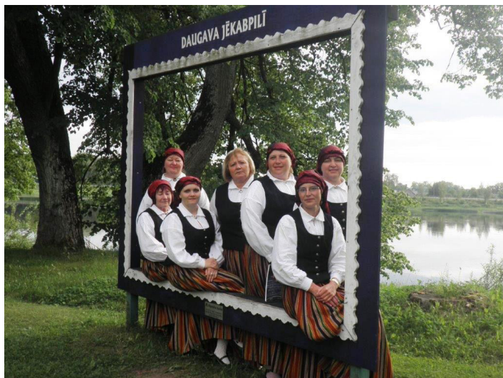
Kora „Runda” dalībnieces Jēkabpilī

Visas savas skaistas dziesmas Es satinu kamolā, Kad izgāju tautiņās, Pa vienai šķetināju.