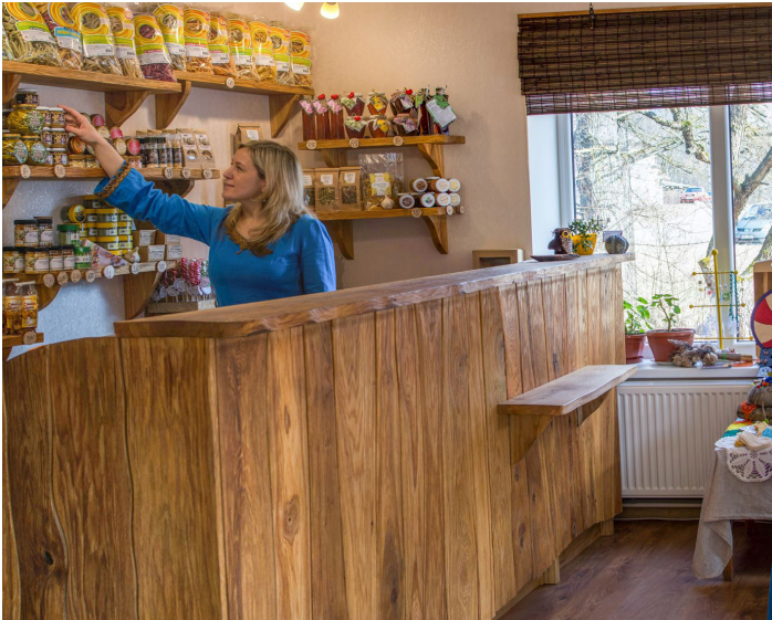
SIA „Latvijas Ķiploks” veikalā iespējams iegādāties ne vien uzņēmumā ražoto produkciju, bet gan daudzu Raunas amatnieku un mājrāzotāju darinājumus

16.jūnijā Rundāles novada domes kolektīvs devās pieredzes apmaiņas braucienā uz Raunas pašvaldību, kur iepazīs ne tik ar Raunas novada domes darbu un struktūru kopumā, bet arī vietējiem uzņēmējiem.