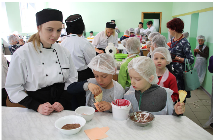
Kā top gardas vafeles Pilsrundāles vidusskolas skolēni izzināja Kandavas Lauksaimniecības tehnikuma Saulaines struktūrvienībā