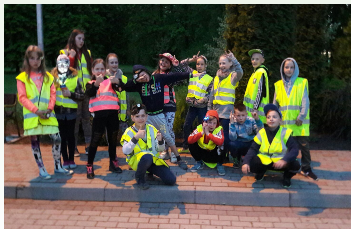
Nakts orientēšanās un dārgumu meklēšana Svitenes muižas parkā izvērtās par interesantu dienas noslēgumu

Tad mēs sagatavojāmies un devāmies atpakaļceļā uz skolu, mājot ardievas Svitenei, kura mūs tik sirsnīgi un mīli sagaidīja un uzņēma. Nu atkal varējām baudīt dabas skaistumu, koši dzeltenos rapšu laukus, putnu čī-