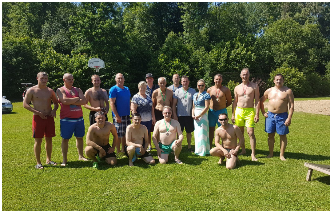
Čempionāta dalībniekus 17.jūnijā lutināja tiešām labi laikapstākļi

17.jūnijā norisinājās ikgadējais smilšu volejbola turnīrs Borisa Muravjova vadībā Līdumniekos. Laika apstākļi šim sporta veidam bija lieliski un uz volejbola laukuma izgāja 16 spēlētāji.