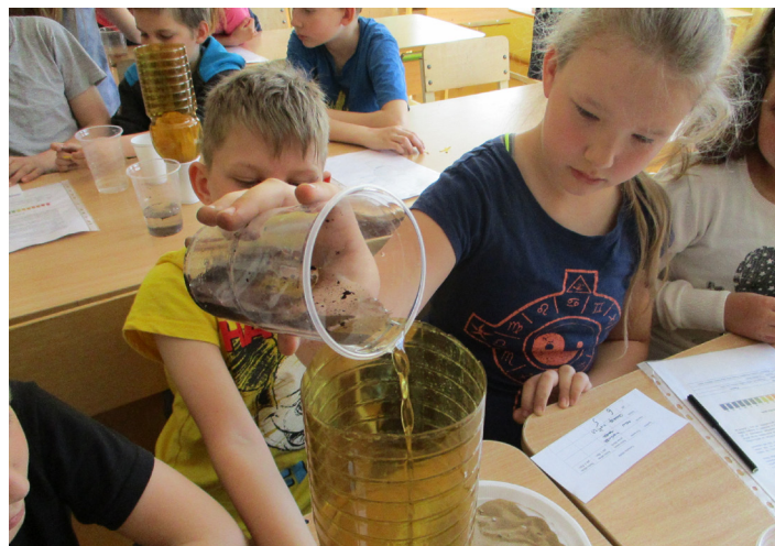
Ūdens attīrīšanas eksperiments