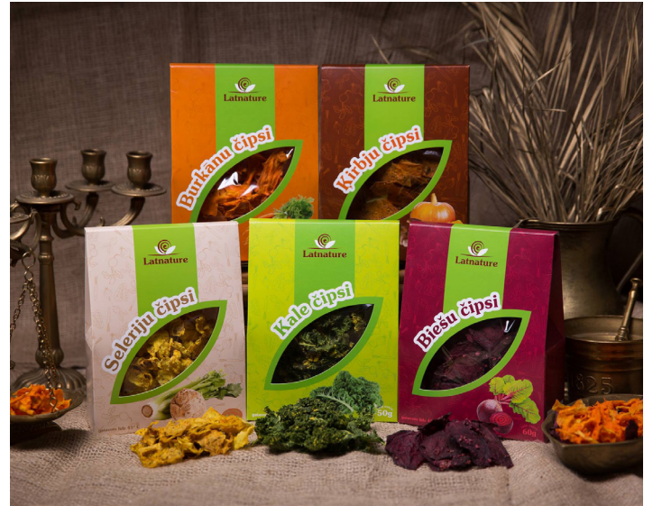
SIA „Latnature” produkcijas klāsts – dārzeņu čipsi

Raunas novada uzņēmēji izveidojuši arī savu naudas vienību, ar kuru šobrīd var norēķināties dažos vietējos uzņēmumos - Ronnenburgas dālderī. Mērķis – piesaistīt tūristus, kā arī veicināt uzņēmējdarbības attīstību