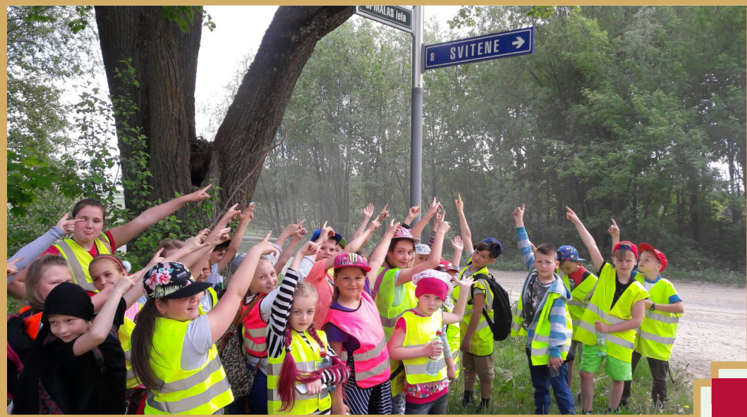
Pārgājiena pirmās dienas galamērķis ir skaids – Pilsrundāle – Svitene, gandrīz 8 kilometri divās stundās un divdesmit minūtēs

Kad visas komandas bija atradušas un atrakušas savus