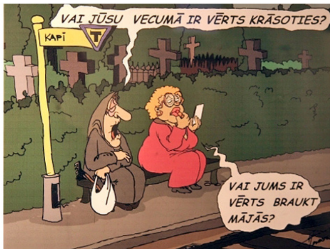
Z.Zaharāns /DADZIS 2006. Nr.12/

Uģa Mežavilka mantinieku īpašumā ir vairāk nekā 30 tradicionālajā audekla un eļļas glezniecības tehnikā gleznotu lielformāta figurālo kompozīciju,