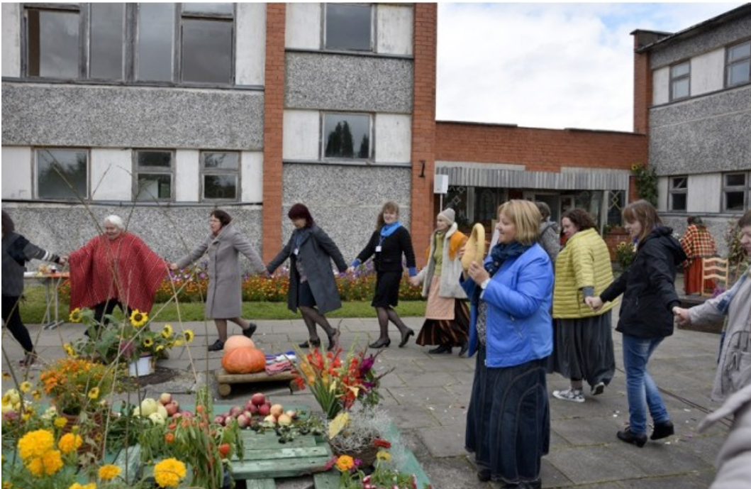
Arī šogad viena stāstnieku festivāla diena tiks aizvadīta ražas svētkos Viesturos, kas pērn izpelnījās apmeklētāju atzinību

NO 22. LĪDZ 23.SEPTEMBRIM RUNDĀLES NOVADĀ NOTIKS JAU SESTAIS ZEMGALES STĀSTNIEKU FESTIVĀLS