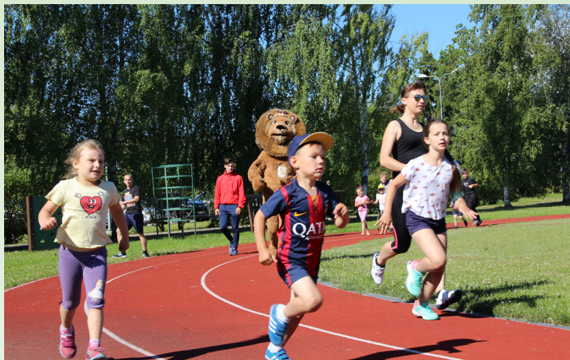
Iesildīšanās kopā ar Rundāles talismanu Lauvu