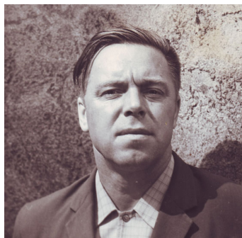
U.Mežavilks /foto no: studija.lv/

Pamazām veidojas Rundāles novadnieku kalendārs, kurā vieta katram, kas te dzimis, audzis un liek mums lepniem būt. Tie ir gan Lāčplēša ordeņa kavalieri, gan ievērojami valstsvīri, gan mākslinieki, gan pašai dziedzīgi un visu mīlēti līdzilvēki. Viņi visi ir mūsu varoņi!