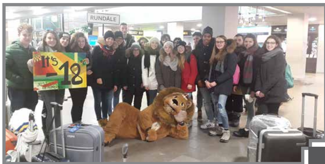
Radoša un sirsnīga itāļu jauniešu sagaidīšana Rīgas lidostā ar Rundāles lauvu un plakātiem, kas vēsta, ka ir tiešām auksts