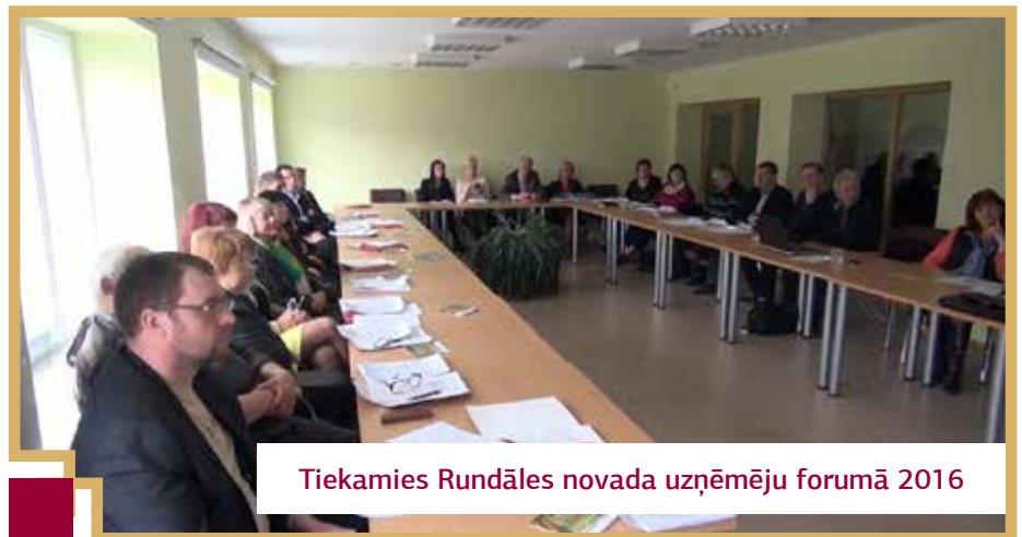
Tiekamies Rundāles novada uzņēmēju forumā 2016

5.februārī Rundāles novadā notiks Uzņēmēju diena 2016. Tā tiks iesākta ar uzņēmēju forumu Svītenes saieta namā, kas sāksies pulksten 10.00.