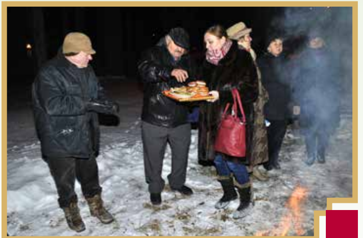
Pasākuma noslēgumā pie simboliskā ugunsкура ikviens tika aicināts cienāties ar karstu tēju un sviestmaizēm