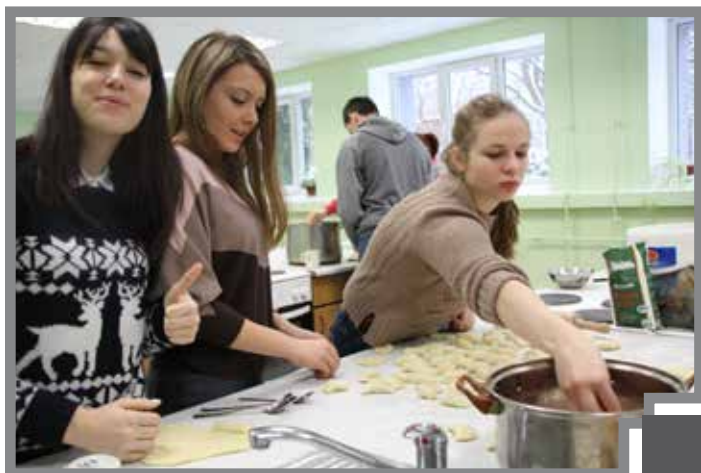
Nacionālo ēdienu diena Saulainē. Katra grupa ceļ galdā savas valsts iecienītos ēdienu