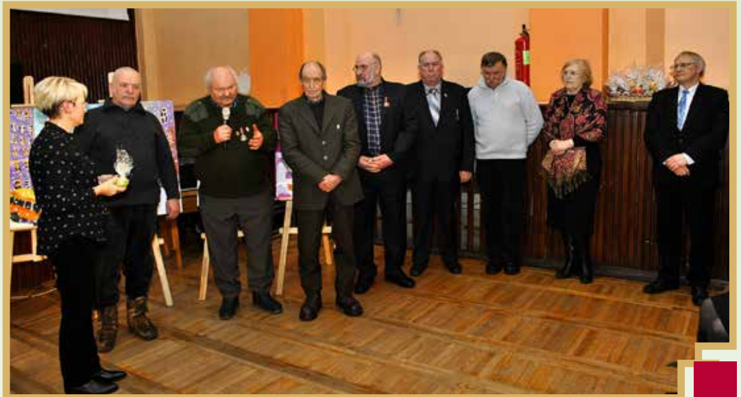
Pasākumā Svitenes tautas namā ikviens varēja atcerēties barikāžu laika notikumus. Sanākušie dalībnieki dalījās savām atmiņām