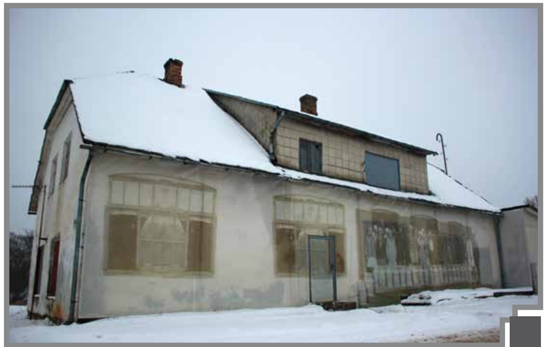
Piena savākšanas punkts Pilsrundālē, ko paredzēts pārveidot par tūrisma informācijas punktu, kā arī uzņēmēju pakalpojumu sniegšanas vietu. Investīcijas plānots piesaistīt no Eiropas Savienības fondu līdzekļiem, paredzot arī pašvaldības līdzfinansējumu

Projektu īstenošanai tika piesaistīti finanšu līdzekļi no Eiropa fondiem, nodrošināts pašvaldības līdzfinansējums un nodrošināts finansējums paš-