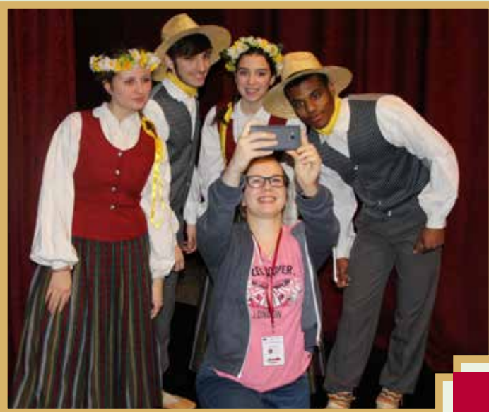
Patiesas ovācijas noslēguma konferencē raisīja Itāļu jaunieši tradicionālajos latviešu tautas tērpos, izpildot tautas dejas