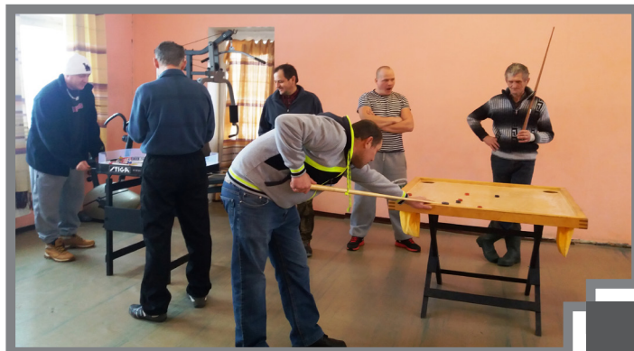
Noskaidrojot spēcīgāko novusa spēlētāju

VIESTUROS JAU VAIRĀK NEKĀ 10 GADUS TUR CIENĀ GALDA SPĒĻU TURNĪRUS