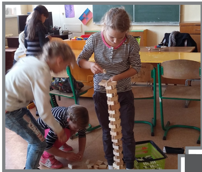
Mirklis no domino klubiņa nodarbībām

mais projekts, kas tiks realizēts ar domes finansiālu atbalstu. Līdz šim aktīvi domes atbalstu izmantojuši seniori – biedrības „Vakarvējš”, „Sudrabupe”, kā arī pērn izveidotā biedrība „Dzīvotprieks”. Pērn ar pašvaldības atbalstu senioru biedrības devušas gan labas pieredzes braucienos, gan organizējušas dažādas tematiskās tikšanās un meistarklases.