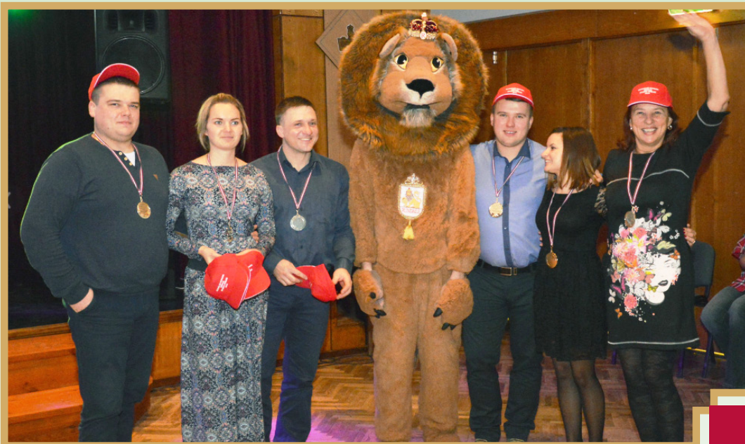
Uzvarētāji – zemnieku saimniecība „Līdakas”