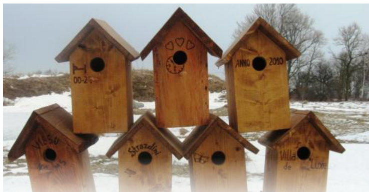
12.martā Vecrundāles bibliotēkā radošā sestdiens „Gājputni atgriežas uz Lieldienām”.

Taisīsim putnu būrus un gatavosim Lieldienu dekorus.