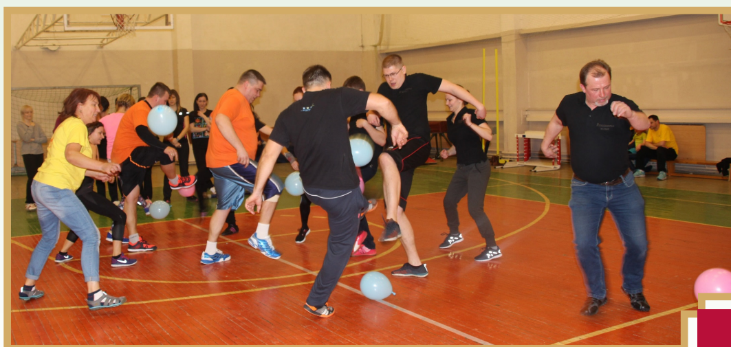
Viena no disciplīnām - balonu cīņas. Pretiniekiem pāri līnijai ir jāpārsit visi savas komandas baloni, kā arī jānosargā savā pusē no uzbrucēju baloniem. Virāk foto www.rundale.lv