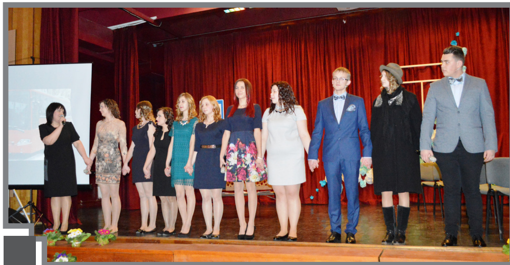
Šogad 12.klasi gatavoja absolvēt vienpadsmit radoši un talantīgi jaunieši

19.februārī notika trīsdesmit piektais Žetonu vakars Pilsrundāles vidusskolā – tāpat šī ir trīsdesmit piektā vidusskolas izlaiduma klase. Šajā mācību gadā vidusskolu absolvēt gatavoja 11 jaunieši.