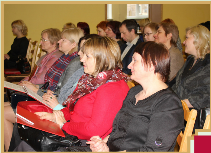
5.martā kultūras darbinieku seminārā Bērstelē pulcējās gan novada kultūras darbinieki, bibliotekāri, nevalstisko organizāciju pārstāvji, gan speciālisti no kaimiņu novadiem

Otrais virziens - Latvijas valstiskuma veidošanās ceļi. Tas veltīts trīs laika dimensijām – pagātnei, tagadnei un nākotnei, aicinot atskatīties uz Latvijas valsts tapšanas ceļiem un līkločiem tuvākā un tālākā pagātnē;