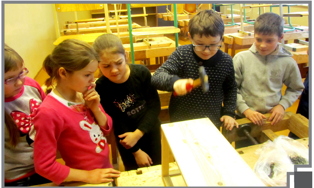
Putnu būrīša radīšanas process

Lai vairāk varētu padalīties ar saviem labās prakses piemēriem, ar saviem ikdienas darbiem un aktivitātēm projektos