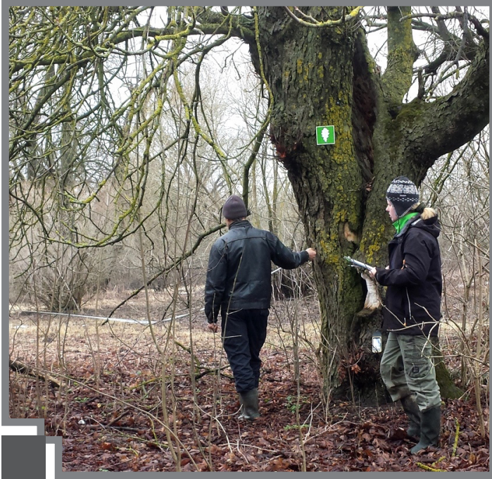
Speciālo dižkoka zīmi ieguvusi arī zirgkastaņa pie Mežotnes baznīcas

Pateicoties vietējo iedzīvotāju iniciatīvai, Dabas aizsardzības pārvaldes darbinieki šogad ir uzsākuši valsts nozīmes dižkoku apsekošanu Rundāles novadā.