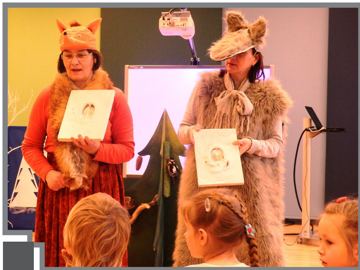
Vai zini, kuram dzīvniekam pieder atstātais pēdu nospiedums? Mazie mārpuķēni tagad zina

Šogad mūsu Ekoskolas programmas tēma ir „Mežs”. Kā mums iepazīt mežu? Kā sadraudzēties ar mežu jau no mazotnes?