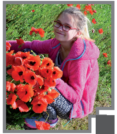
Magonu laukā

2016. gada 15. janvārī oficiāli tika atklāts Jaņa Rozentāla jubilejas gads. Latviešu glezniecības pamatlicēja Jaņa Rozentāla 150. gadadiena tiek svinēta ar plašu un daudzveidīgu programmu visā Latvijā un mēs- Mākslas skolas audzēkņi un skolotāji- pievienojamies plašajam svinētāju pulkam.