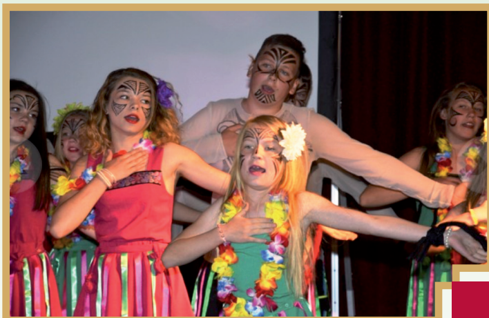
„Savējie” vidējā grupa ar izrādīmaoru leģendas "AOTEAROA"

deju svētku virsvadītāja Indra Filipšone.