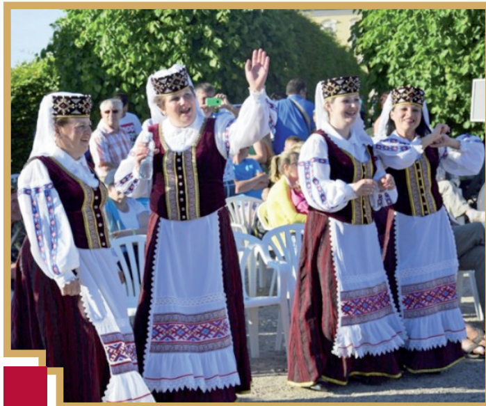
Atraktīvās dziedātājas no folkloras ansambļa "Pušanskije napevi" no Baltkrievijas