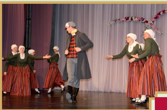
Vidējās paaudzes deju kolektīvs "Rundāle" skatē izpildīja deju „Kur tu iesi ciema puisi"