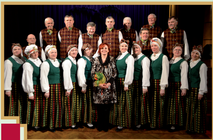
Senioru deju kolektīvs "Šurpu turpu"

Pavasaris ir laiks, kad amatierkolektīvi visā Latvijā piedaloties skatēs, parāda savu varēšanu un izaugsmi. Arī mūsu novada amatierkolektīvi var lepoties ar labiem rezultātiem.