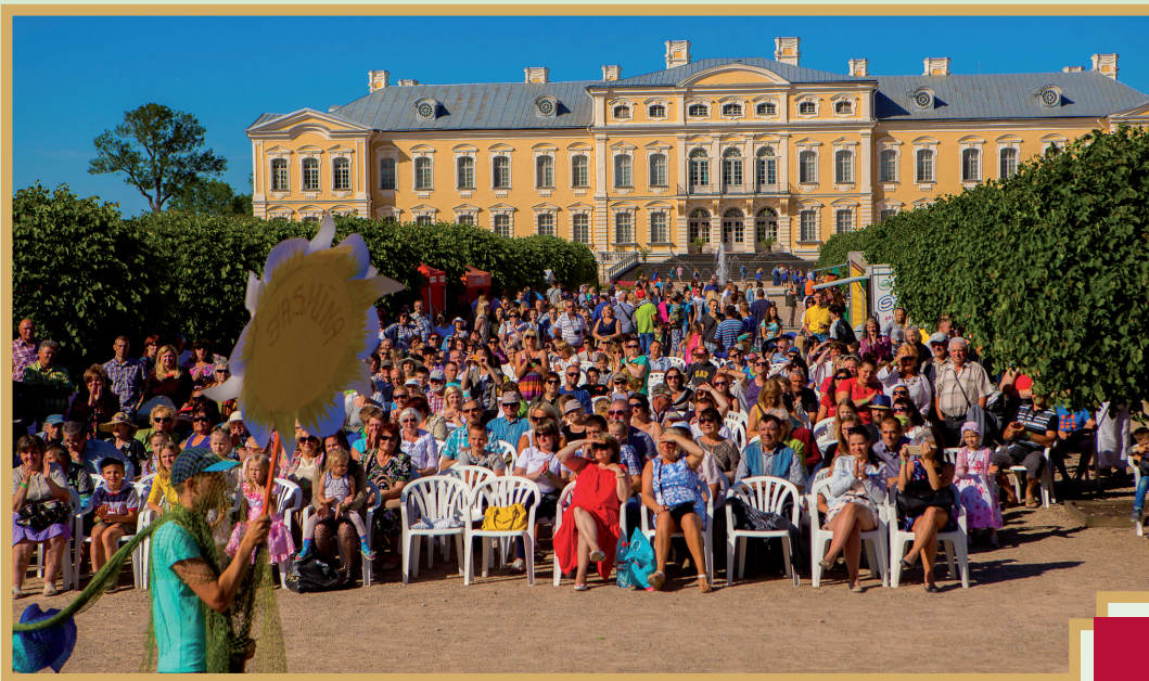
Svētku dienā Rundāles pils dārzu piepildīja simtiem cilvēku. Vairāk foto meklē www.rundale.lv