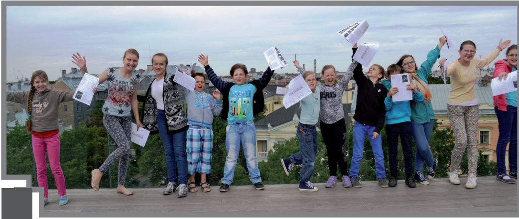
Mācību ekskursija uz Nacionālo muzeju