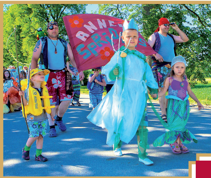
Gājiena pirmās vietas ieguvēji – „Annele” un „Sprīdītis” mazie dejotāji