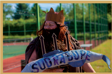
Attēlā augšā – senioru biedrība „Sudrabupe” šogad gājienā ieguva otro vietu Attēlā pa labi – sadraudzības pašvaldības no Itālijas arfu spēlētāji