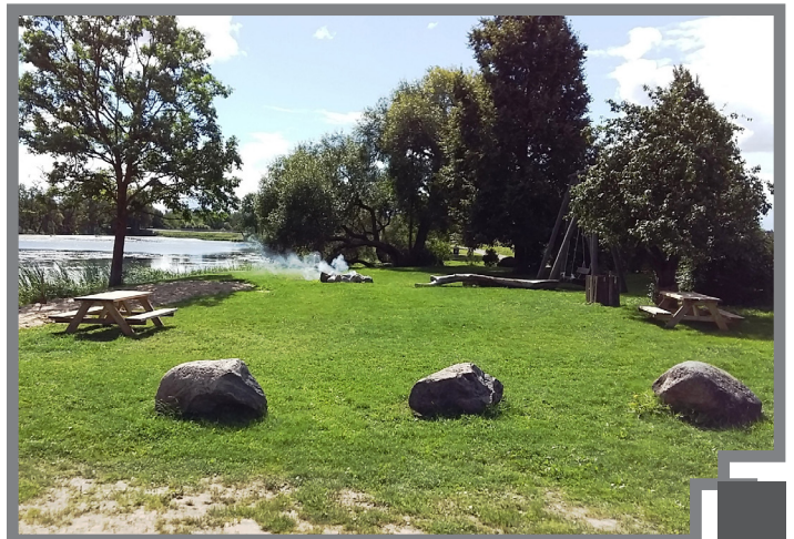
Atpūtas vieta pie Dzirnauvūdenskrātuves

Pašvaldības finansētā projektu konkursa „Iedzīvotāji veido savu vidi” ietvaros biedrība “Jauniešu EUREKA” ir saņēmusi finansējumu projekta „Dzirnavu atpūtas zonas labiekārtošana un paplašināšana” realizācijai. Kopējā projekta izmaksu summa veido 791 eiro, no kuriem 607 eiro ir Rundāles novada domes finansējums, 184 – biedrības līdzfinansējums.