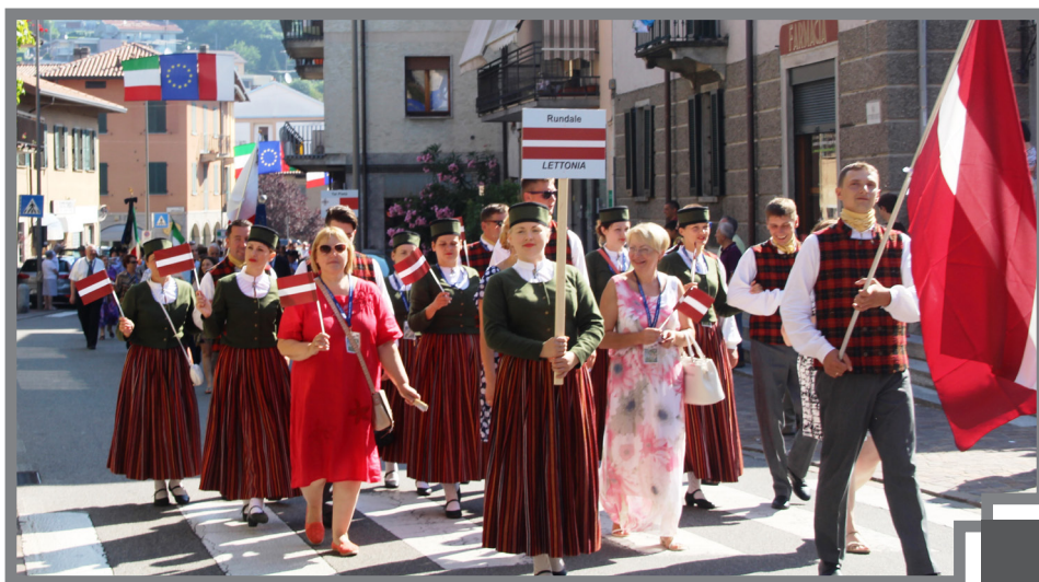
Rundāles novada delegācija gājienu 9.jūlijā Udziates pilsētas centrālajā ielā