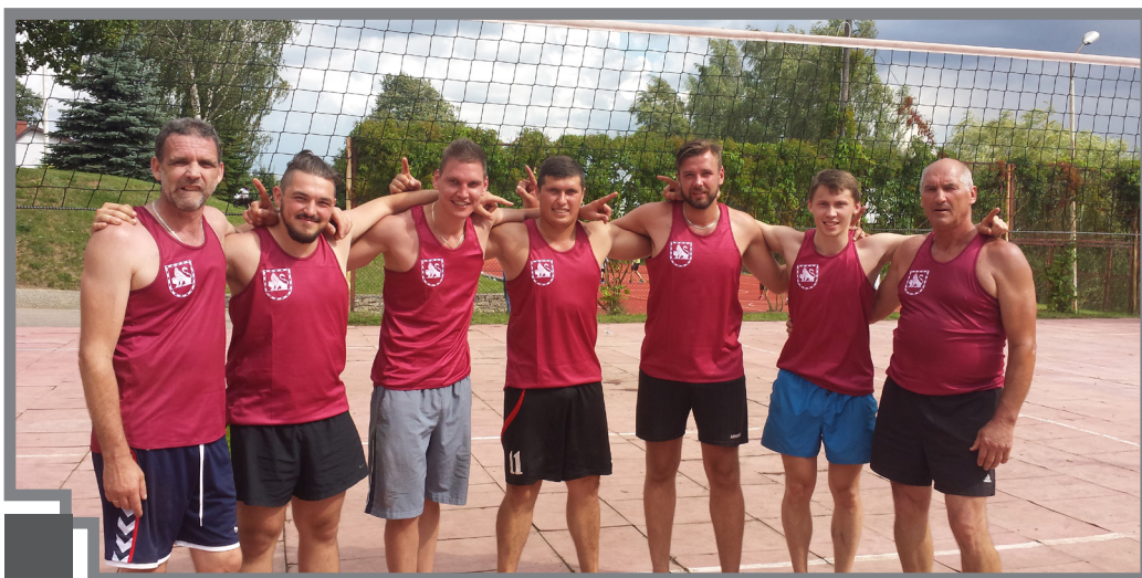
Rundāles novada volejbola komanda