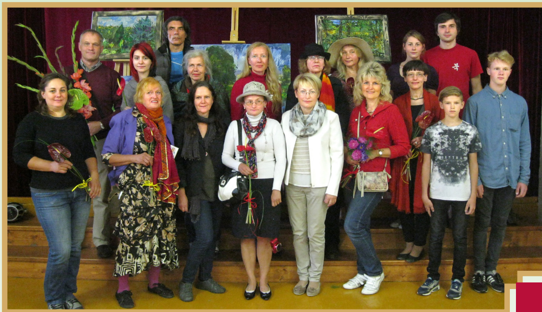
Svitenes piektā mākslas plenēra dalībnieku kopbilde

No 8. līdz 13.augustam Svitenē norisinājās piektais mākslas plenērs