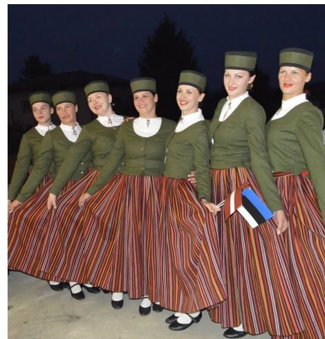
Vidējās paaudzes deju kolektīva dejotājas pirms uzstāšanās kultūras vakarā 8.jūlijā