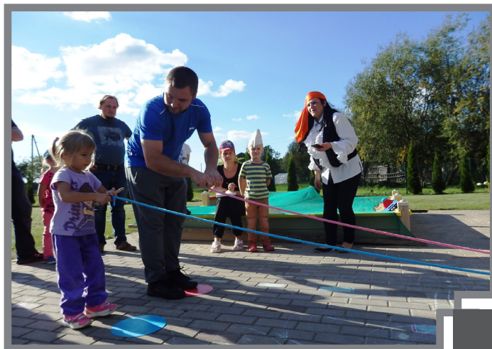
Saskaņoti – tētis un meitiņa veic uzdevumu

Jau otro gadu Tēvu dienas ietvaros mārpuķēni savus tētus, vectēvus un krusttēvus aicināja uz PII „Mārpuķīte”, lai visi kopā aktīvi iesaistītos sportiskās aktivitātēs.