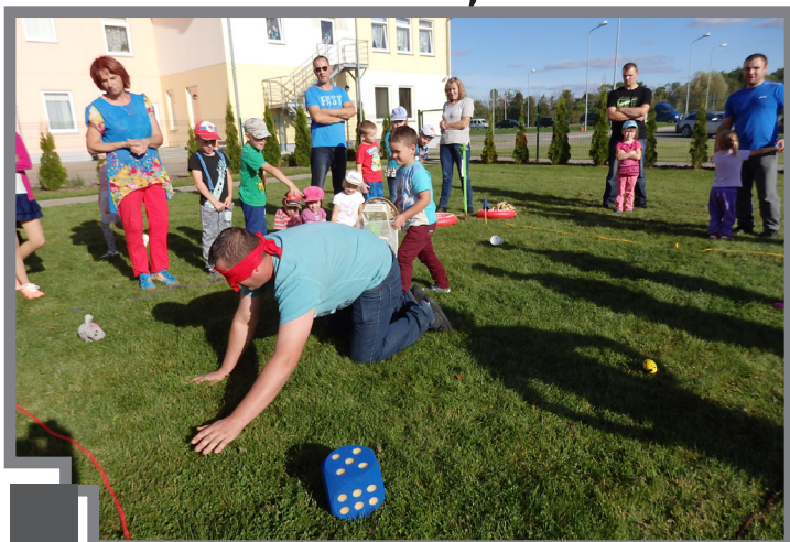
Viena no aktivitātēm - meklējot nozaudētos dārgumus