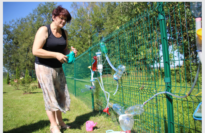
Iepriekšējā mācību gada noslegumā PII „Mārpuķīte” tika izveidota ūdens siena