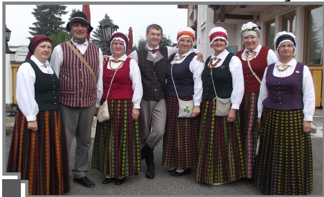
Folkloras kopa Svitene Bavārijā

Doties kalnā uz izslavēto Ludviga II Pasaku pilī Noišvanštainu, omu nespēja sabojāt pat nemitīgais lietus. No pamatīgas izmirkšanas nevienu nepasargāja ne plēves mētelīši, ne lietussargi. Protams, ne visas dienas bija lietainas. Arī saulainās dienās izbaudījām Alpu kalnu ainavas, ēku daudzveidīgos krāsainos ziedos ieslīgušās logu palodžītes, īpatnējos apiņu laukus un rūpīgi kopotos laukus. Zinām, kā garšo vācu tradicionālais ēdiens „knēdeļi”. Ar pacēlāju uzbraucām Hohe Bogen