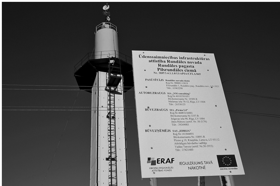
2014.gadā nozīmīgi finanšu līdzekļi tika ieguldīti ūdensvadu un kanalizācijas tīklu un dzīlurbumu rekonstrukcijai Viesturos, Saulainē un Pilsrundalē

9. Svitenes pagasta pārvaldes ēkas rekonstrukcija un skolas telpu un bērnu darztu telpu iekārtošana;