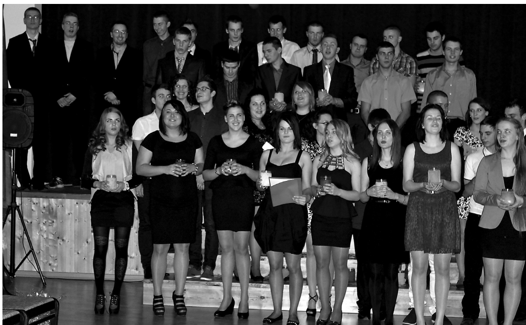
Žetonu vakars Saulaines Profesionālajā vidusskolā

Gada nogale, kā ierasts, iezīmējas ar saspringtu darba ritmu gan mācību, gan ārpus klases darbā. Šajā laikā tradicionāli mūsu skolā tiek organizēts Žetonu vakars 4. kursu audzēkņiem un pašdarbības kolektīvu Ziemassvētku koncerts.