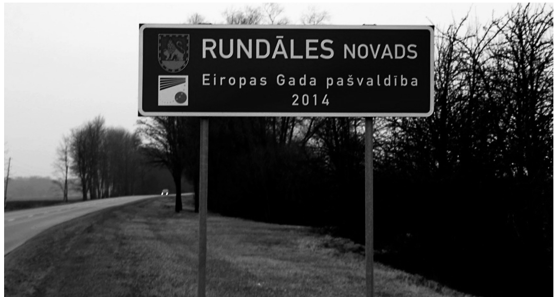
Sveiciens iebraucot novadā.

30.decembra novada domes sēdē deputāti apstiprināja Rundāles novada pašvaldības budžetu 2015.gadam. Pašvaldības 2015. gada prioritātes, salīdzinot ar iepriekšējiem gadiem, nemainīsies, saglabājot uzsvāru uz drošas, kvalitatīvas un ilgtspējīgas dzīves vides radīšanu Rundāles novada iedzīvotājiem.