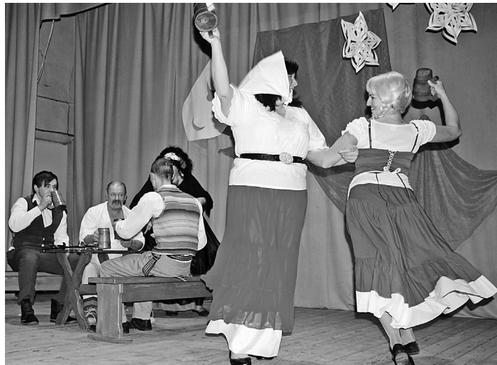
"Šurumburums" izspēlēja skatus no filmas "Vella kalpi" – krogus aina

Vakara gaitā, kas ieilga gandrīz līdz pusnaktij, režisori un kolektīvi izteica cerību un vēlmi satīties šādos pasākumos arī turpmāk. Tika apspriestas iespējas nākotnē apmainīties ar izrādēm un uzvedumiem, kā arī pārrunāta pieredze saistībā ar novados organizētajām amatier-teātru skatēm un to žūrijas, diemžēl, bieži vien subjektīvo vērtēju-