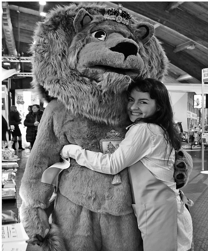
Rundāles lauva tūrisma izstādē Ķīpsalā

Tūrisma izstādē Balttour 2015 pirmo reizi tika prezentēts arī jaunais Rundāles novada talismans – lauva.