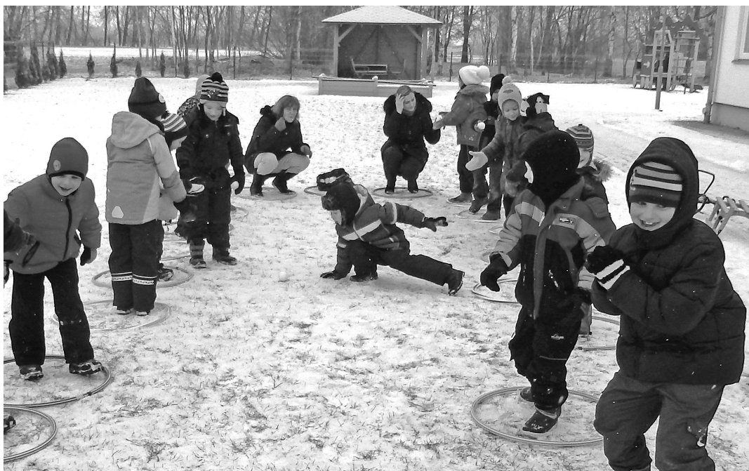
Viena no pieturvietām – sniega pikū padošana ķēdītē

Pirmsskolas vecums ir vienīgais izglītības posms, kad sporta nodarbības bērniem ir katra dienu.