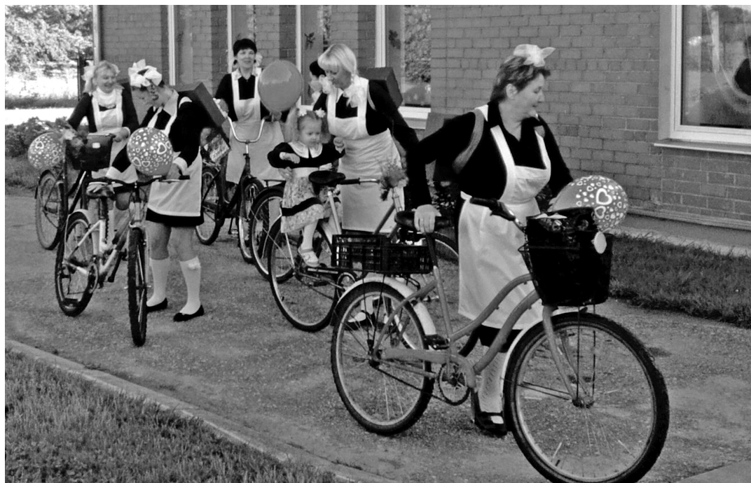
Zinību dienas pulcēšanās pie skolas - skolotāji un darbinieki formas tērpos

Nomināciju "Gada brauciens" ieguva ceļojums uz zoodārzu. Arī "Gada pārsteigums" bija piešķirtā balva - bezmaksas Zoodārza apmeklējums par dalību akcijā "ZOOZĪLUKS" no Zoodārza administrācijas. Nominācijā "Gada tikšanās" vairums nobalsoja par tikšanos ar policijas darbiniekiem, kuriem bija līdzī runcis Rūdolfs un bebrs Bruno. Par "Gada Jauno tradīciju" izvirzīja piparkūku darbnīcu Ziemassvētku eglītē. Par "Gada aktivitāti pirmsskolā" tika nosaukti skaistie, mainīgie lo-