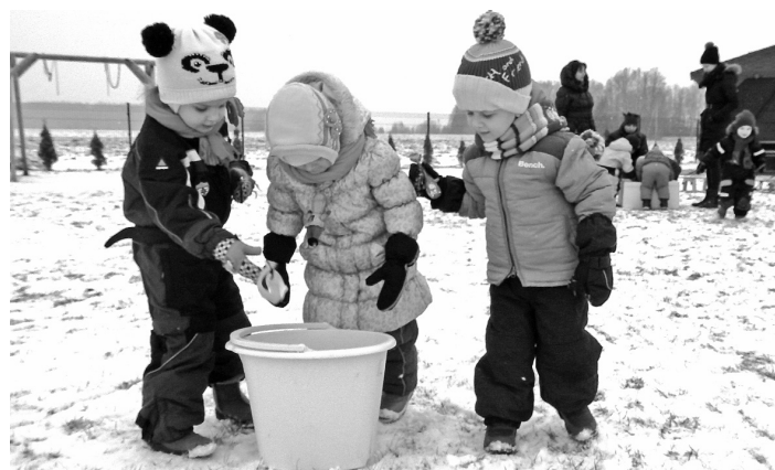
Zemledus maksķerēšanas karstumā

Pavisam nesen, 4.februārī, tika organizēta ziemas sporta izpriecās arā. Bērni kopā ar grupu, spor-