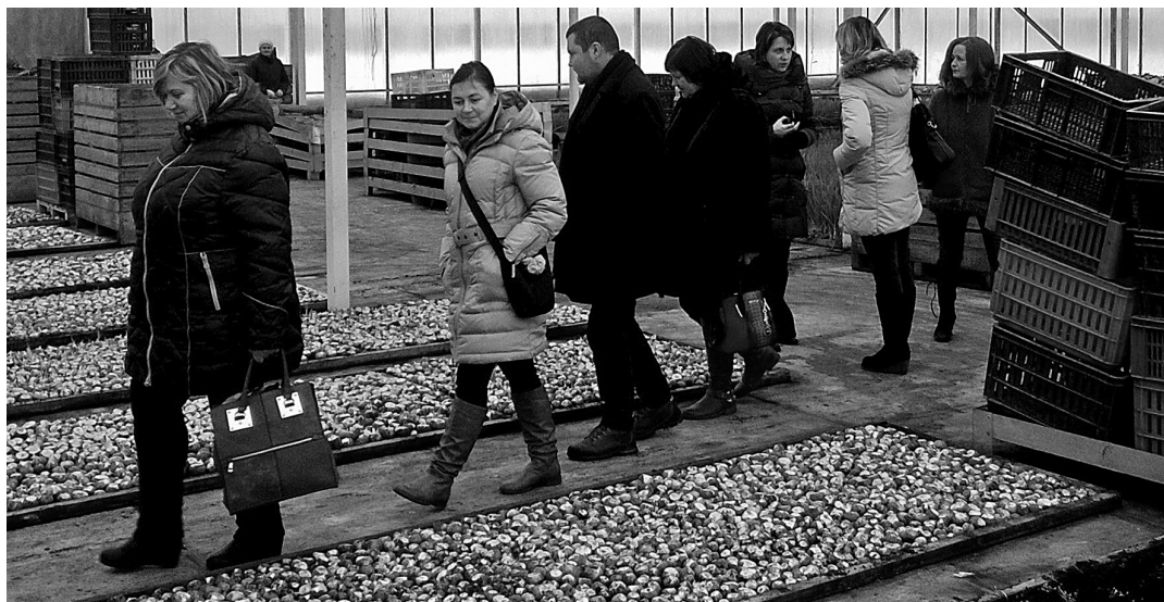
Pozitīvi Rundāles novada dārzeņu audzētājus esot pārsteigusi 1500m 2 lielā siltumnīca ar iestādītiem sīpoliem locīņu iegūšanai

Dzirdētās lietas mēs aizrautīgi apspriedām mājup ceļā, bet