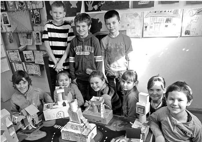
Viens no klases radošajiem darbiem "Fantāziju pilsēta"

Pilsrundāles vidusskolas 2.b klase ir iesaistījusies kārtējā projektā caur e-Twinning platformu - ar kuras palīdzību tiek atrasti jauni projekta partneri.