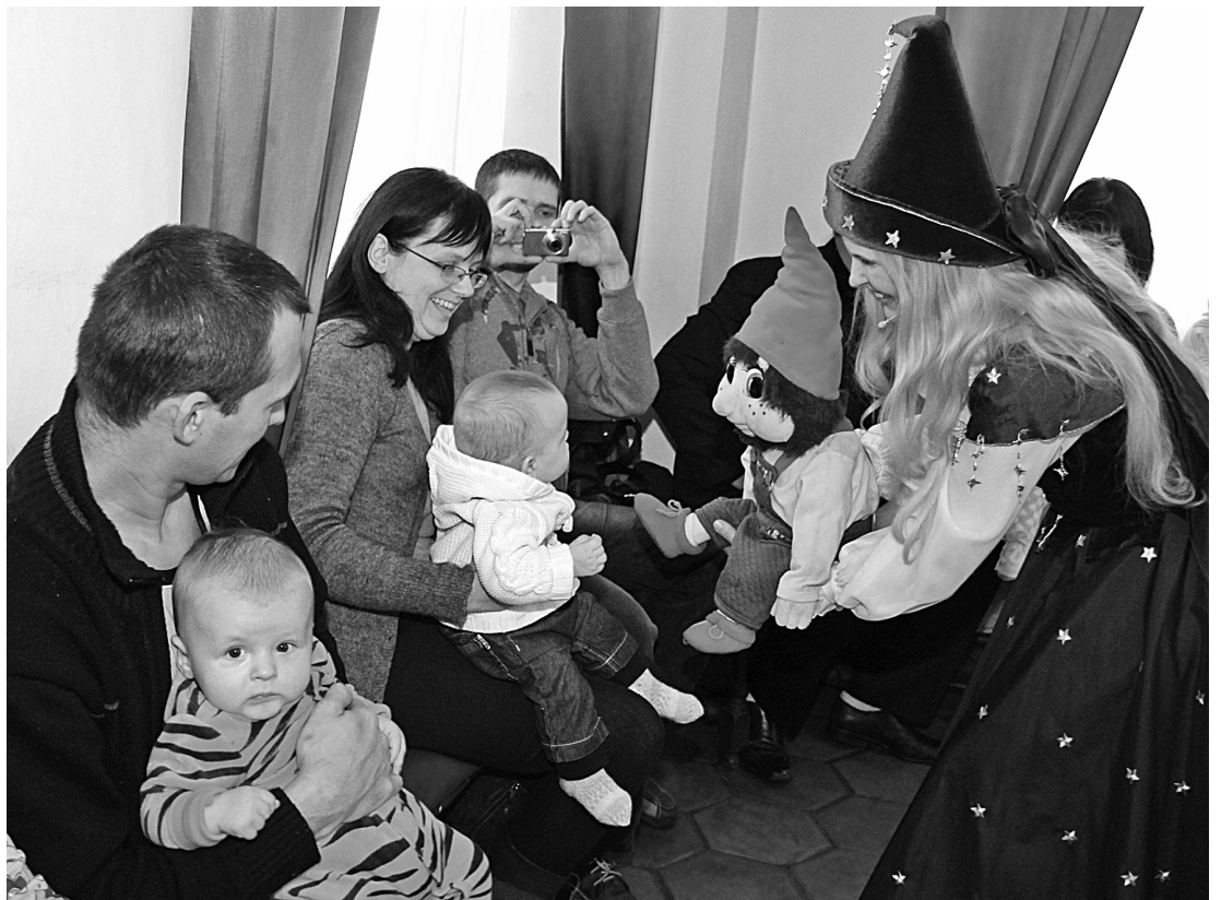
Mirkļis no jaundzimušo sveikšanas pasākuma 2012.gadā

4.maijā Saulainē pirmsskolas izglītības iestādē "Mārupukīte" notiks tradicionālais jaundzimušo Rundāles novada iedzīvotāju sveikšanas pasākums "Mīlestības brīnums".