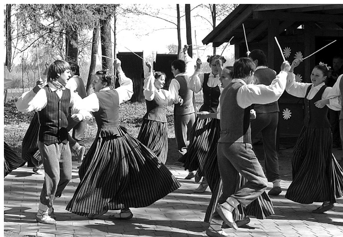
Lielais bazārs

Apskatīt fotogrāfijas no izstādes "Musturdeķu stāsti" atklāšanas var Kultūras un tautas mākslas centra "Ritums" mājas lapā www.ritums.lv Galerijas.