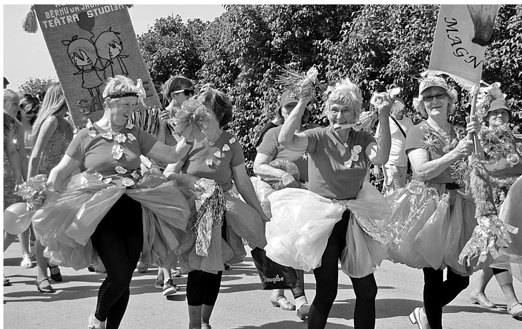
Svētku gājienam allaž gatavojamies ar pamatīgu izdomu un radošumu. Attēlā: Kreatīvās "Magnoliju" dāmas

Lai padarītu svētkus skaistākus un krāšņākus sev un viesiem, aicinām novada iedzīvotājus iesaistīties novada kopējā noformējumā, jau tagad stādot un audzējot ziedus novada krāsās - sarkanā un dzeltenā.