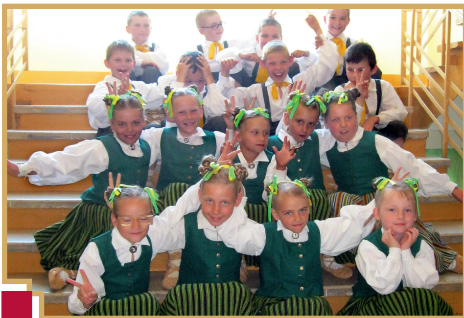
Pilsrundāles vidusskolas TDK „Madaras” 1.-2.klases kolektīvs

Neizprotami šķita arī tas, ka Valsts prezidents un citi vadītāji piedalījās gājienā, kas faktiski bija nesankcionēts. Arī ar mūsu novada bērniem viss bija kārtībā, bērni bija veseli un ar prieku būtu piedalījušies gājienā, ja ministre jau sākotnēji būtu nevis atcēlusi gājienu, bet gan ļāvusi pašām pašvaldībām uzņemties atbildību par dalību. Bijām pilnībā gatavi gājienam – 7.-9. klašu