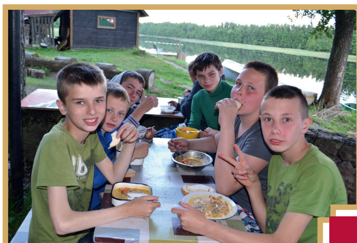
Neizpaliekoša nometņu vērtība – uz ugunsroma pašu spēkiem gatavotas maltītes

Pēdējā laika jaukātais atklājums ir kempings "Pērlīte" pie Viesītes, kurā arī ir ļoti fi-