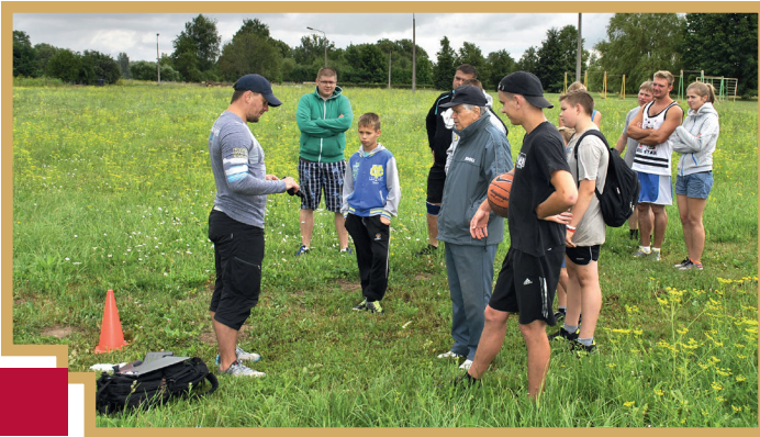
Arī Vasaras sporta spēlēs lielu dalībnieku interese par šaušanu ar pneimatisko pistoli