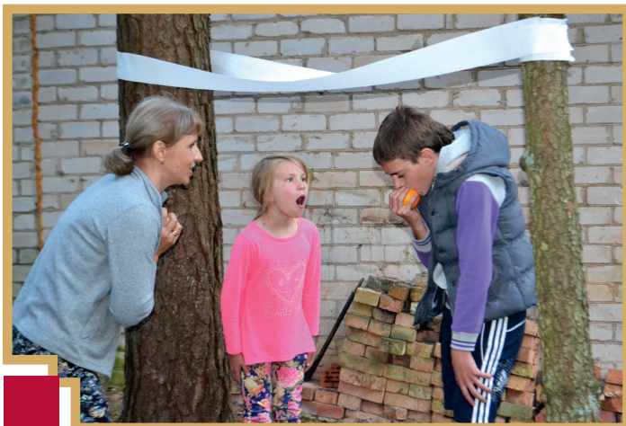
Teātra improvizācijas nodarbībās var izpaust visas aktierdotības

Nu jau 20 gadus, kopš pastāv teātra studija "Savējie", esam katru vasaru devušies atpūtas un mācīšanās nometnē.